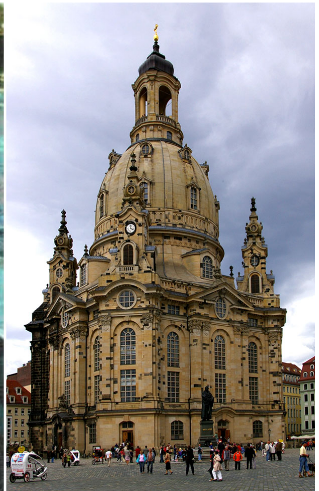
(Αριστερά) Εικ.1, (Δεξιά εικόνα) Εικ.2, Frauenkirche, Δρέσδη.

Η ανακατασκευή έχει γίνει κομβικό εργαλείο της Δεξιάς, ενώ τα μέσα ενημέρωσης της Νέας Δεξιάς ασχολούνται τα τελευταία χρόνια όλο και πιο πολύ με την αρχιτεκτονική. Αυτό ευνοείται από το γεγονός ότι σήμερα υπάρχουν πολύ περισσότερες εκδόσεις αυτού του πολιτικού φάσματος από ό,τι πριν 20 χρόνια. Τότε, δεξιοί ιστορικοί τέχνης σαν τον Richard W. Eichler είχαν τη δυνατότητα να εκδίδουν τα βιβλία τους -π.χ. Η επιστροφή του Ωραίου ( Die Wiederkehr des Schönen , 1984) ή Αρχιτεκτονική Κουλτούρα εναντίον της Καταστροφής της Μορφής ( Baukultur gegen Formzerstörung , 1999)- στο αραχνιασμένο νεοναζιστικό περιβάλλον του εκδοτικού οίκου Grabert στο Τύμπινγκεν, που βρισκόταν υπό παρακολούθηση και συνεχίζει να παρακολουθείται και σήμερα από την Υπηρεσία Προστασίας του Συντάγματος. 1 Οι σημερινοί ομοϊδεάτες τους έχουν δυνατότητες δημοσίευσης με μέσα πολύ πιο προηγμένα και ελκυστική εικονογράφηση, που περνούν εντελώς απαρατήρητες από τις ομοσπονδιακές διωκτικές αρχές εξαιτίας της σύμπραξης της ακροδεξιάς με τη συντηρητική δεξιά.