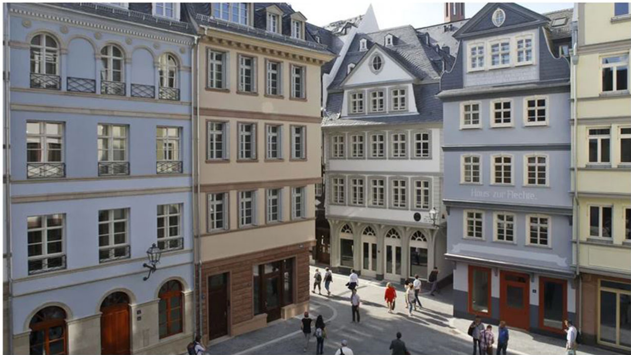
Es könnte die Fotografie einer Modelleisenbahnstadt sein. Ist aber eine der neuen Mitte von Frankfurt am Main.

9. September 2018, 14:42 Uhr / Erschienen im Merkur / 241 Kommentare