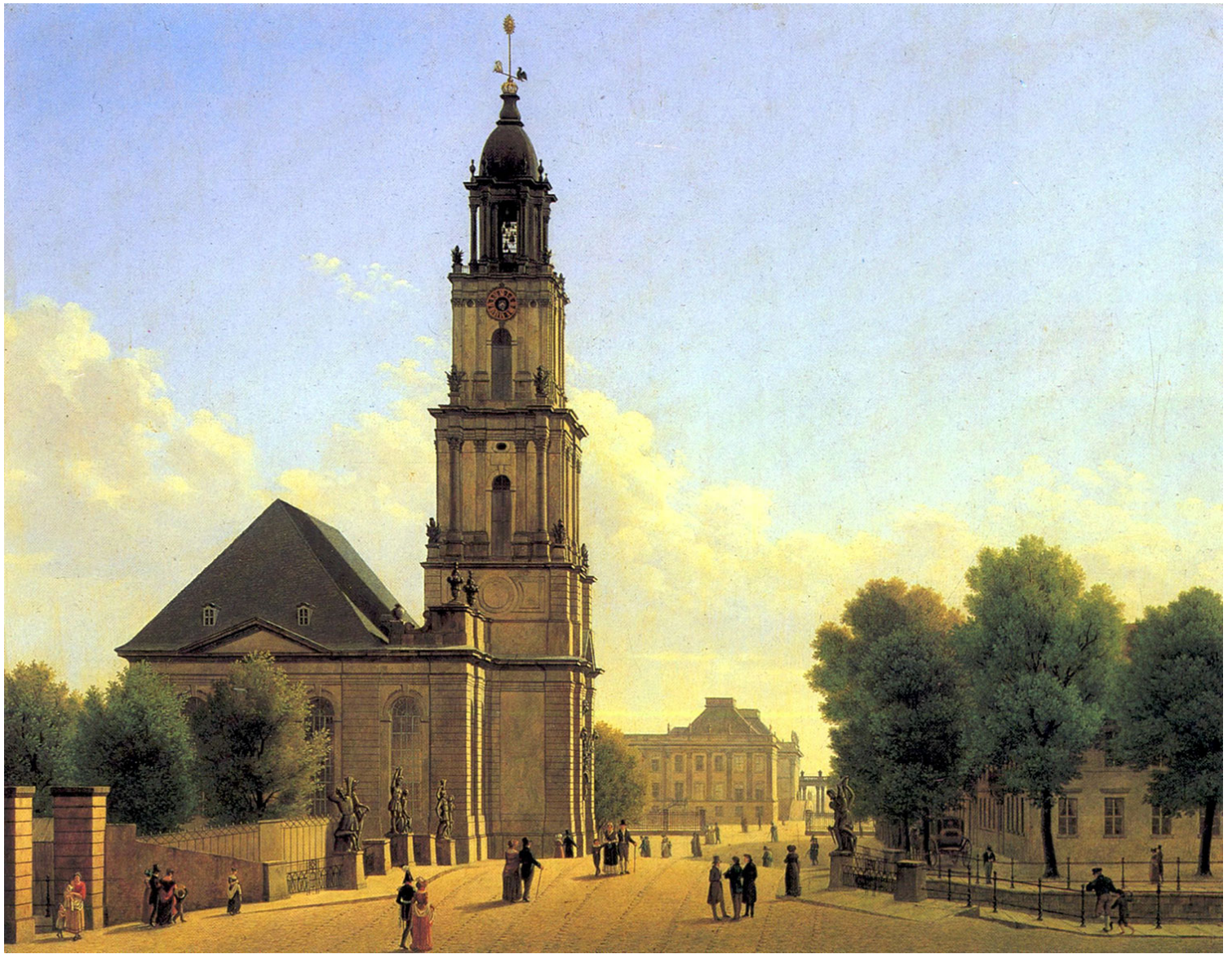
Εικ.4, Carl Hasenpflug, «Η εκκλησία της Στρατιωτικής Φρουράς του Πότσδαμ», 1827.

διανοούμενων και άλλων προβεβλημένων πολιτών.