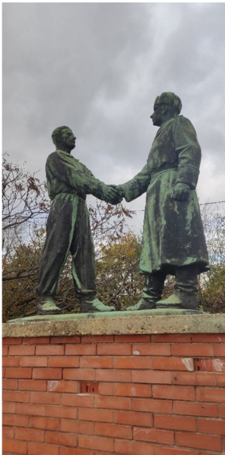
Πάνω: γλυπτό στο εσωτερικό του πάρκου | Κάτω: αριστερά ο Λένιν, δεξιά ο Ούγγρος υποδέχεται εγκάρδια τον στρατιώτη του Κόκκινου Στρατού