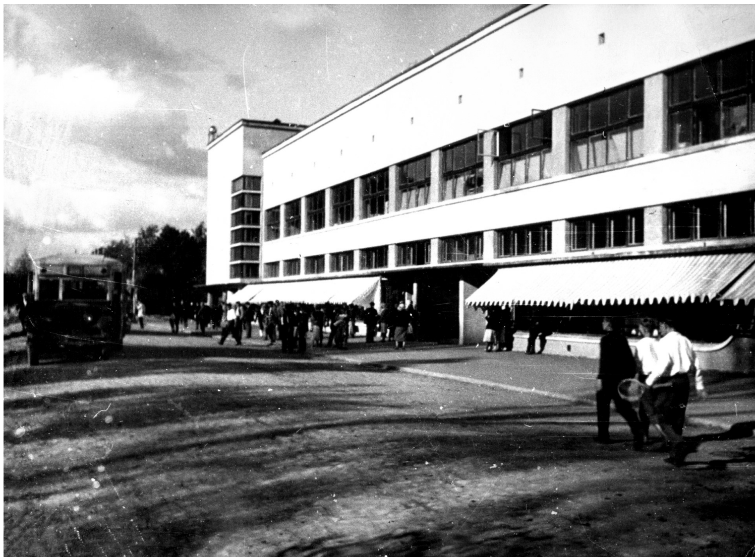
Εικόνα 5. Το κεντρικό κατάστημα προμηθειών στη κομμούνα του Μπολσεβό. Φωτογραφία circa 1930.

Και οι δύο κομμούνες αποτελούν παραδείγματα αποτελεσματικής αστειακής οριοθέτησης σε ζώνες, μια ιδέα που δεν έχει ακόμη εφαρμοστεί στην πράξη σε άλλες σοβιετικές πόλεις της εποχής. Πέρα από τα κειμενικά τεκμήρια που καταδεικνύουν ότι οι αστικοποιητές είχαν γνώση των εγχειρημάτων του Makarenko, ο σχεδιασμός των κομμούνων δείχνει πως οι σχεδιαστές τους τις αντιλαμβάνονταν ακριβώς ως μικρές πόλεις που αποτελούν οργανικά σύνολα, σε συγκεκριμένες οριοθετήσεις, υποδομές και ανάγκες, και όχι απλά κοιτώνες πέριξ ενός εργοστασίου. Όλες οι σημαντικές σοσιαλιστικές πόλεις της πρώτης περιόδου της σοβιετικής αστειακής ανάπτυξης σχεδιάστηκαν ταυτόχρονα με τα εν λόγω εγχειρήματα (1929-1930) και υλοποιήθηκαν 3-4 χρόνια μετά. Σύγχρονός τους ήταν επίσης ο διάλογος μεταξύ αστικοποιητών και αποαστικοποιητών (1929-1931).