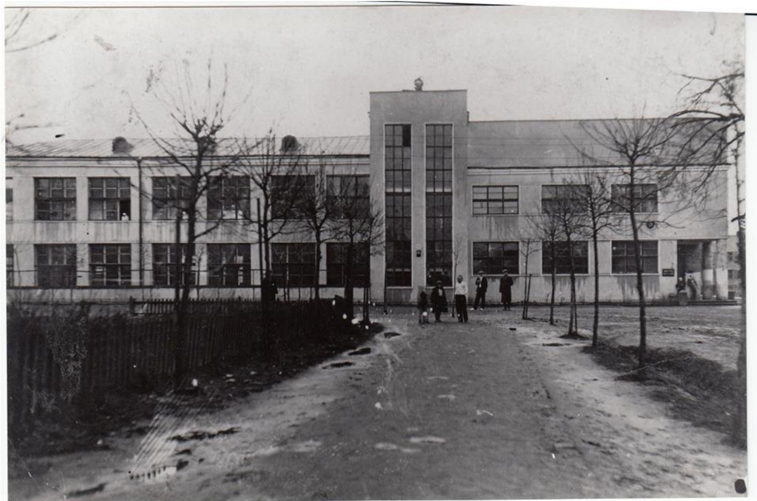
Εικόνα 4. Το εργοστάσιο-κουζίνα στο Μπολσεβό. Φωτογραφία circa 1930.