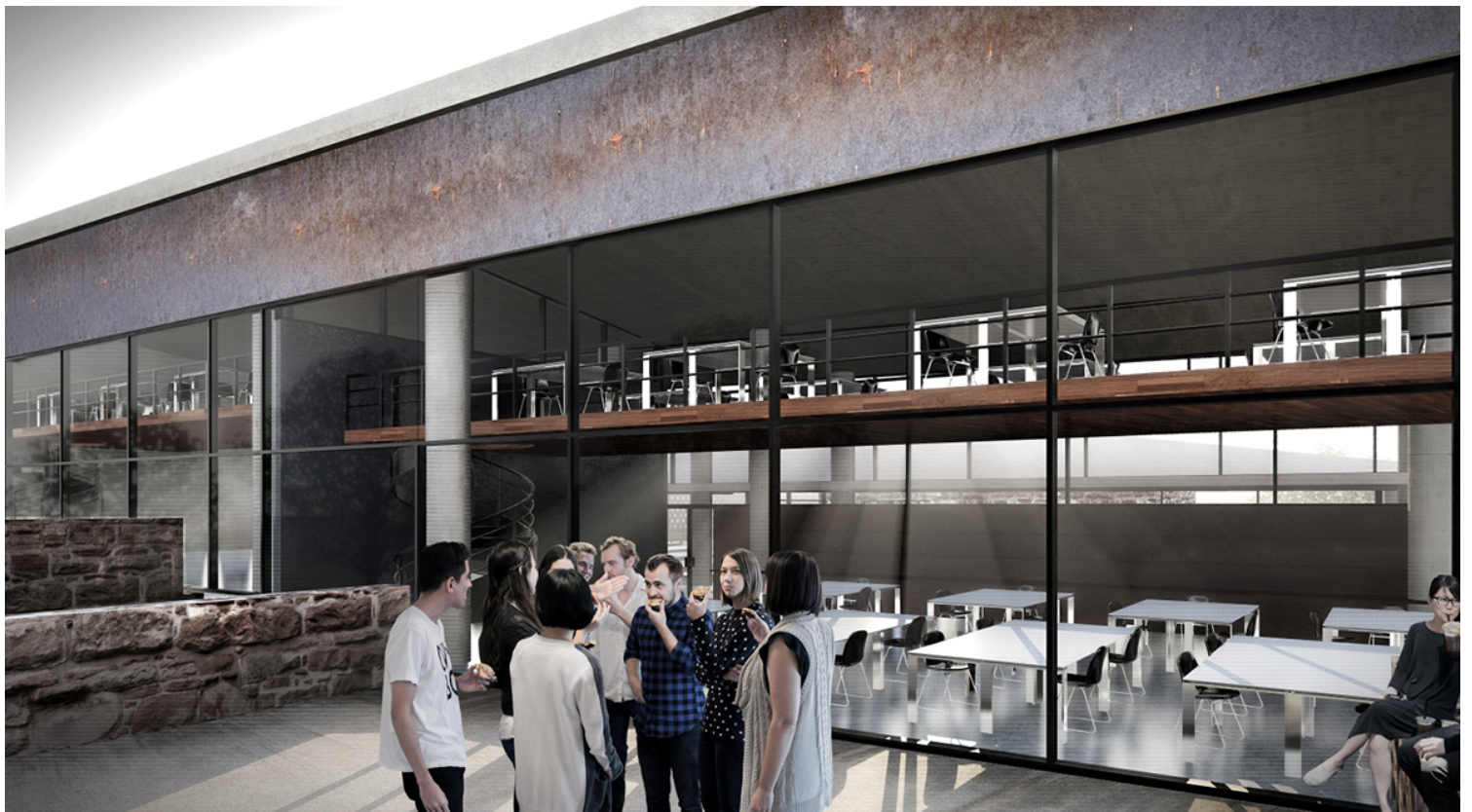
ΧΩΡΟΣ ΕΚΤΟΝΩΣΗΣ ΕΝΟΣ ΤΥΠΙΚΟΥ ΣΧΕΔΙΑΣΤΗΡΙΟΥ - STUDIO