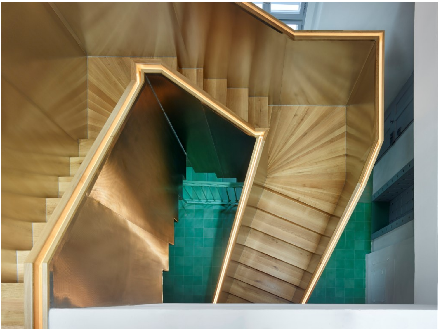
Silver House, Jihlava, Czech Republic, Atelier Štěpán

Η αρχική ξύλινη στέγη του 1893 παρουσίαζε δομικά προβλήματα και δεν μετέφερε επαρκώς τις πλευρικές δυνάμεις στη λιθοδομή. Το δάπεδο κάτω από το πατάρι βρισκόταν σε κρίσιμη κατάσταση. Ο επανασχεδιασμός εισήγαγε νέα ζεύξη και μια οριζόντια σχισμή φωτισμού ακριβώς πάνω από το γείσο, διατηρώντας το αρχικό σχήμα της στέγης -το οποίο ανυψώθηκε ελαφρώς. Έτσι, η νέα στέγη διαχωρίζεται οπτικά από την ιστορική τοιχοποιία. Η σύνθεση αντλεί έμπνευση από την κλασική αρχιτεκτονική διαίρεση σε αρχιτράβη, μετόπες με τρίγλυφα και γείσο, με τη σχισμή φωτισμού να αναλαμβάνει τον ρόλο του ρυθμού μετόπης-τρίγλυφου- μια ιστορικά ακριβή αναφορά. Η κορδέλα-παράθυρο συνοδεύεται από φεγγίτες διακριτικά ενσωματωμένους στην ασημί μεταλλική επικάλυψη της στέγης.