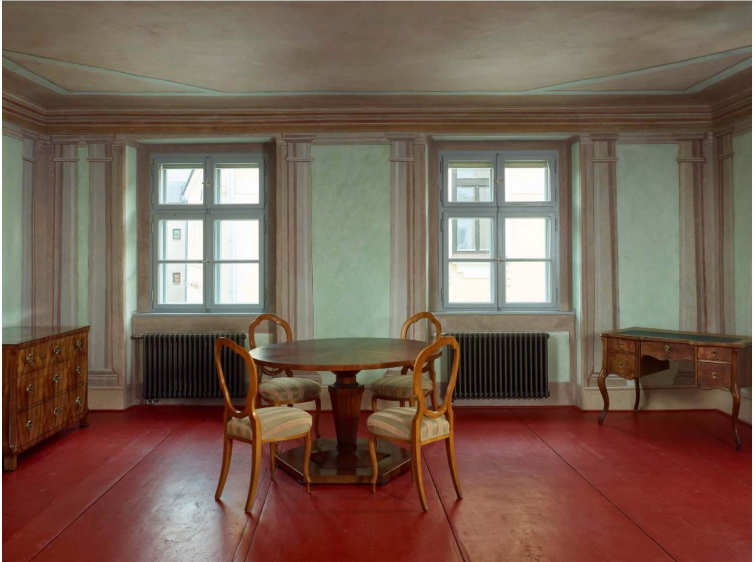
Silver House, Jihlava, Czech Republic, Atelier Štěpán | Images: Filip Šlapal

Προς τον κήπο, ένα κυβικό προσάρτημα από μαυρισμένο σκυρόδεμα και ένα πέπλο από μεταλλικό πλέγμα από ανοξείδωτο χάλυβα αντικαθιστούν την παλαιά πτέρυγα της αυλής. Πρόκειται για μια προσεκτικά μελετημένη προσθήκη, που μεταφέρει βασικές βοηθητικές λειτουργίες εκτός του ιστορικού κτιρίου. Εκεί στεγάζεται ο χειμερινός κήπος του τσαγερίου και μια σκάλα στο σημείο όπου παλιό και νέο συναντώνται, φωτισμένη από φεγγίτη στην οροφή.