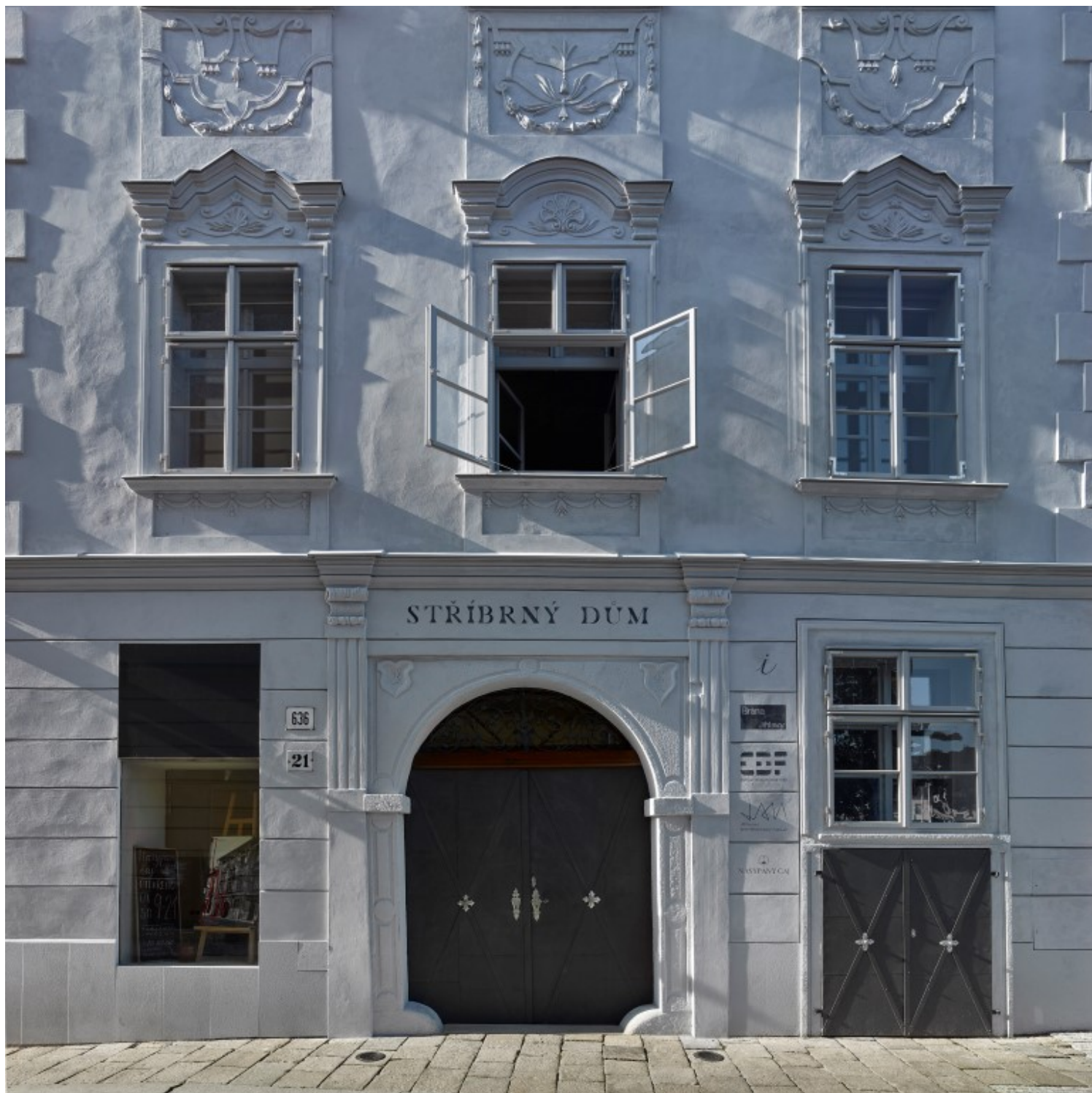
Silver House, Jihlava, Czech Republic, Atelier Štěpán

Η περίοδος της Αναγέννησης καθόρισε τη χωρική διάταξη και τον αρχιτεκτονικό ρυθμό ( traveé ) του κτιρίου. Μεταγενέστερες ανακαινίσεις κατά του 18ο και 19ο αιώνα ακολούθησαν αδέξια αυτή τη διάταξη, θολώνοντας τη σαφήνεια της αρχικής διαρρύθμισης. Ο νέος σχεδιασμός αποκαλύπτει την αρχική, ενιαία κάτοψη , η οποία είναι αρκετά ευέλικτη ώστε να προσαρμοστεί σε μελλοντικές λειτουργικές ανάγκες.