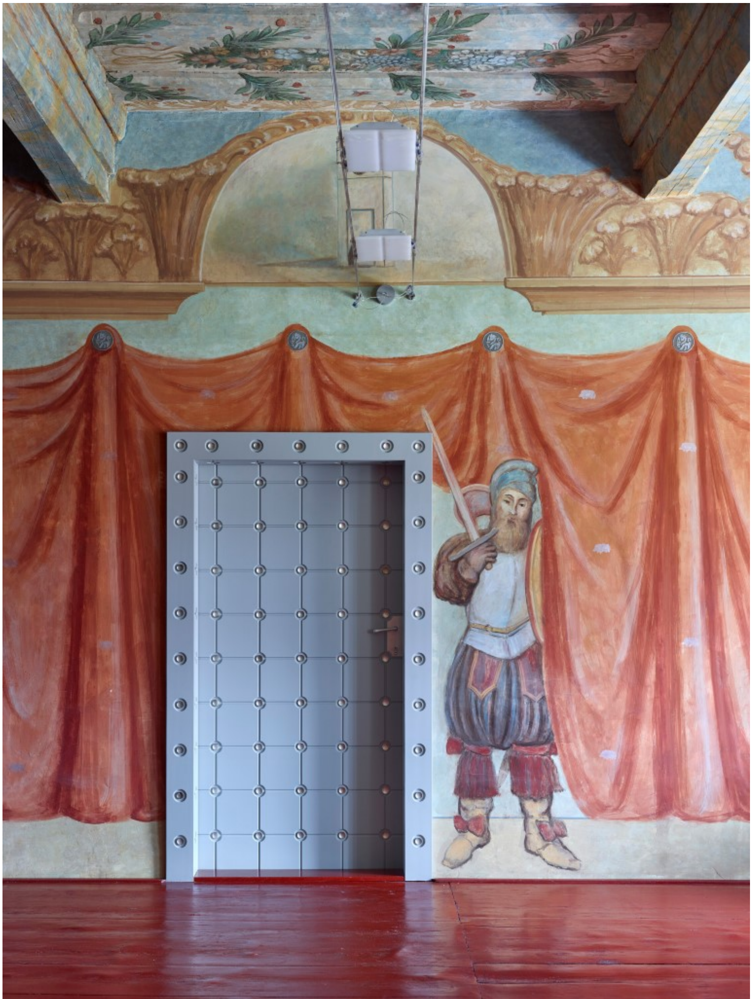
Silver House, Jihlava, Czech Republic, Atelier Štěpán