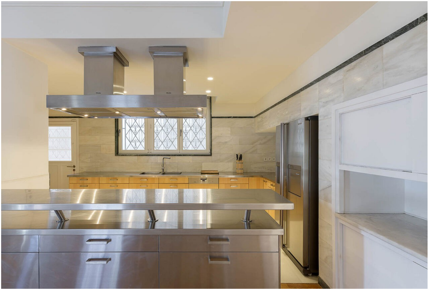
Exarcheia Penthouse Unit | Ευγενική παραχώρηση του γραφείου lowfat architecture