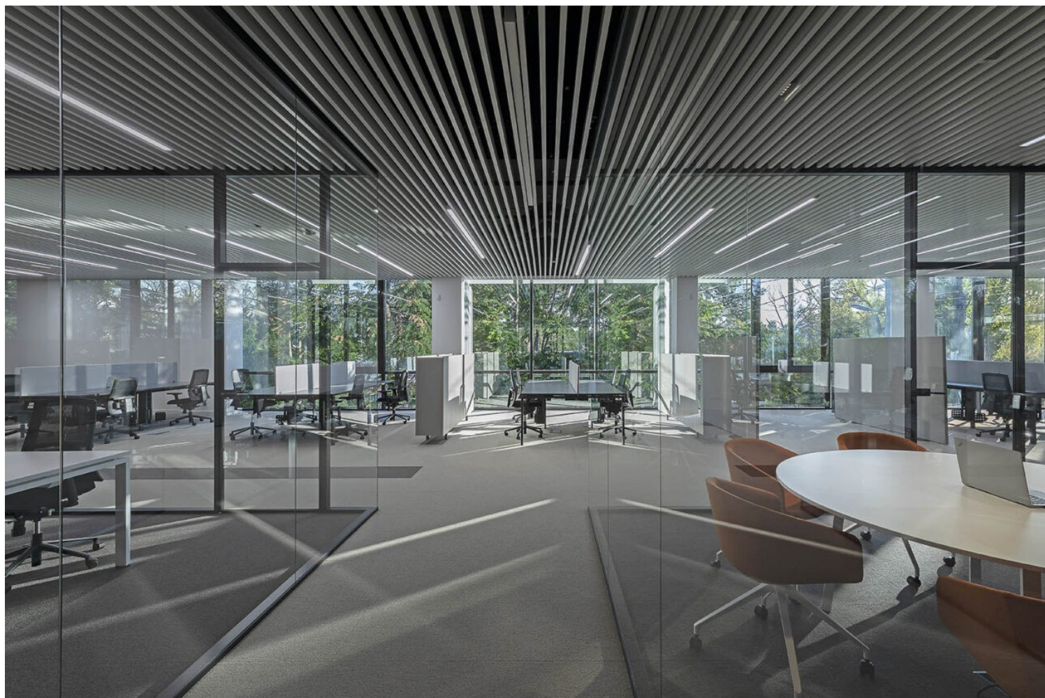
Motodynamics Office | Ευγενική παραχώρηση του γραφείου lowfat architecture

Τέλος, επιμεληθήκαμε την ίδια την κατασκευή του έργου. Το γραφείο μας έχει ένα δομημένο “in-house” κατασκευαστικό τμήμα, που υλοποιεί τις μελέτες μας κατασκευαστικά στο εργοτάξιο. Αυτό το τμήμα στήριξε το συγκεκριμένο έργο, κρατώντας μία ιδανική ισορροπία μεταξύ κόστους και τελικής ποιότητας.