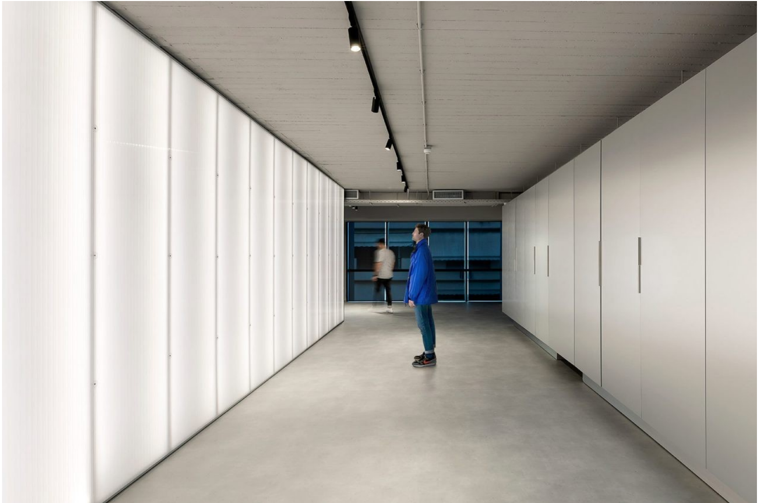
Security Operations Center | Ευγενική παραχώρηση του γραφείου lowfat architecture

Ο χαρακτηρισμός “lowfat” χρησιμοποιήθηκε στην αρχή χιουμοριστικά, ως “ευφυολόγημα”, για να περιγράψει τα πρώτα έργα μας, αλλά καθιερώθηκε στη συνέχεια ως όνομα της ομάδας μας, περιγράφοντας ακριβώς αυτό που συνεχίζουμε και εξακολουθούμε να κάνουμε: Την αφαιρετικότητα στον σχεδιασμό, τη λιτή προσέγγιση στις μορφές, την καθαρότητα των όγκων και των υλικών, τη συνέπεια προς τη λειτουργικότητα και την αισθητική, δηλαδή μία συνθετική και σχεδιαστική προσέγγιση χωρίς υπερβολές.