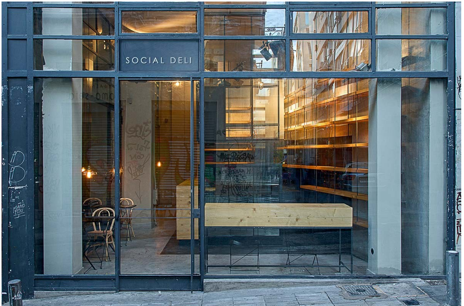
Social Delli | Ευγενική παραχώρηση του γραφείου lowfat architecture

Χάθηκε ο Στόχος της ίδιας της Αρχιτεκτονικής, που είναι ένα εργαλείο για να δομηθεί η «Πόλη», το αληθινό εργαστήριο που εμπνέει με τα αρχέτυπα της αρμονίας, της δικαιοσύνης και της ομορφιάς, που διαμορφώνει Πολίτες και παράγει «Πολιτισμό».