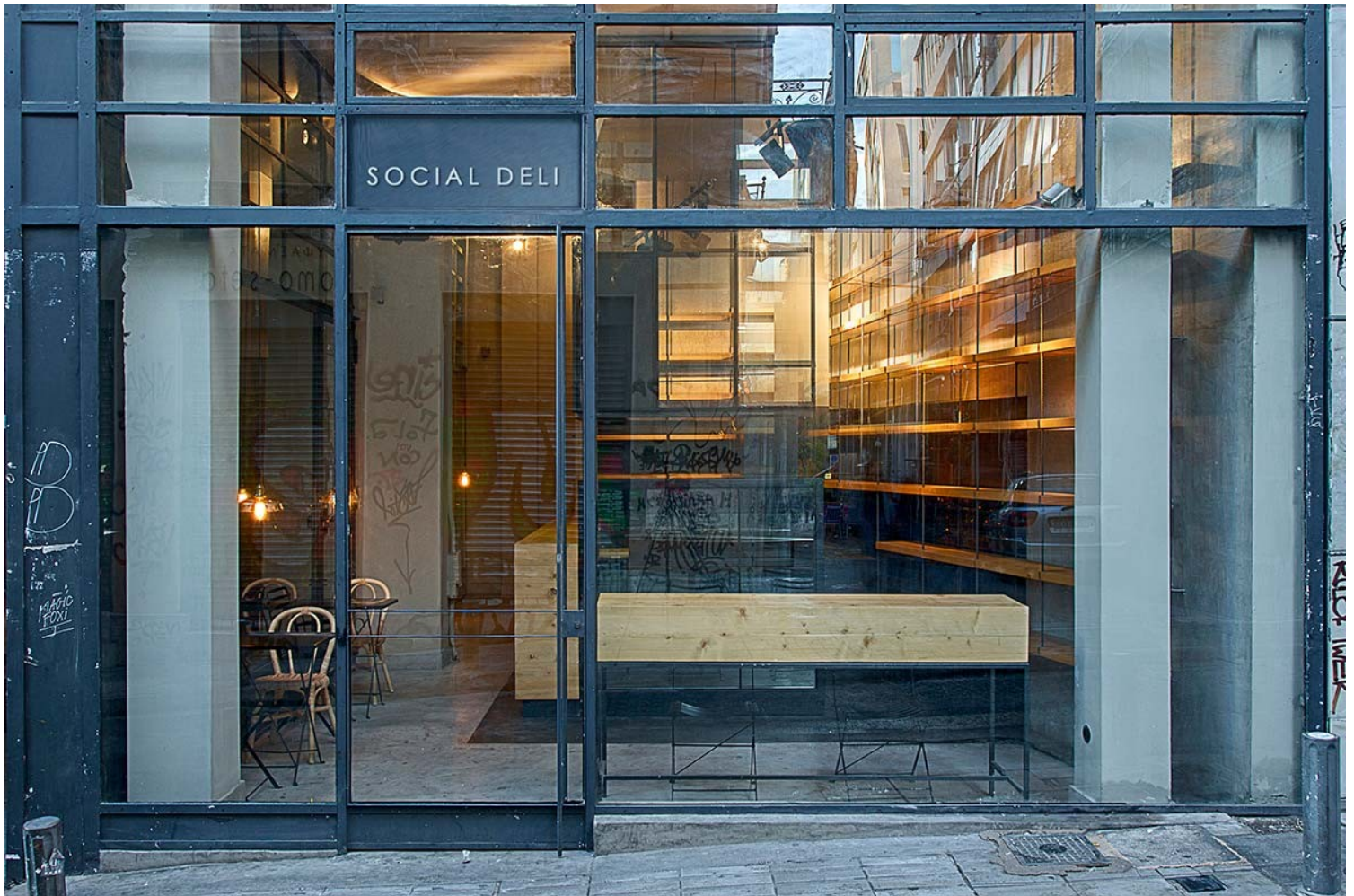
Social Delli | Ευγενική παραχώρηση του γραφείου lowfat architecture

Χάθηκε ο Στόχος της ίδιας της Αρχιτεκτονικής, που είναι ένα εργαλείο για να δομηθεί η «Πόλη», το αληθινό εργαστήριο που εμπνέει με τα αρχέτυπα της αρμονίας, της δικαιοσύνης και της ομορφιάς, που διαμορφώνει Πολίτες και παράγει «Πολιτισμό».