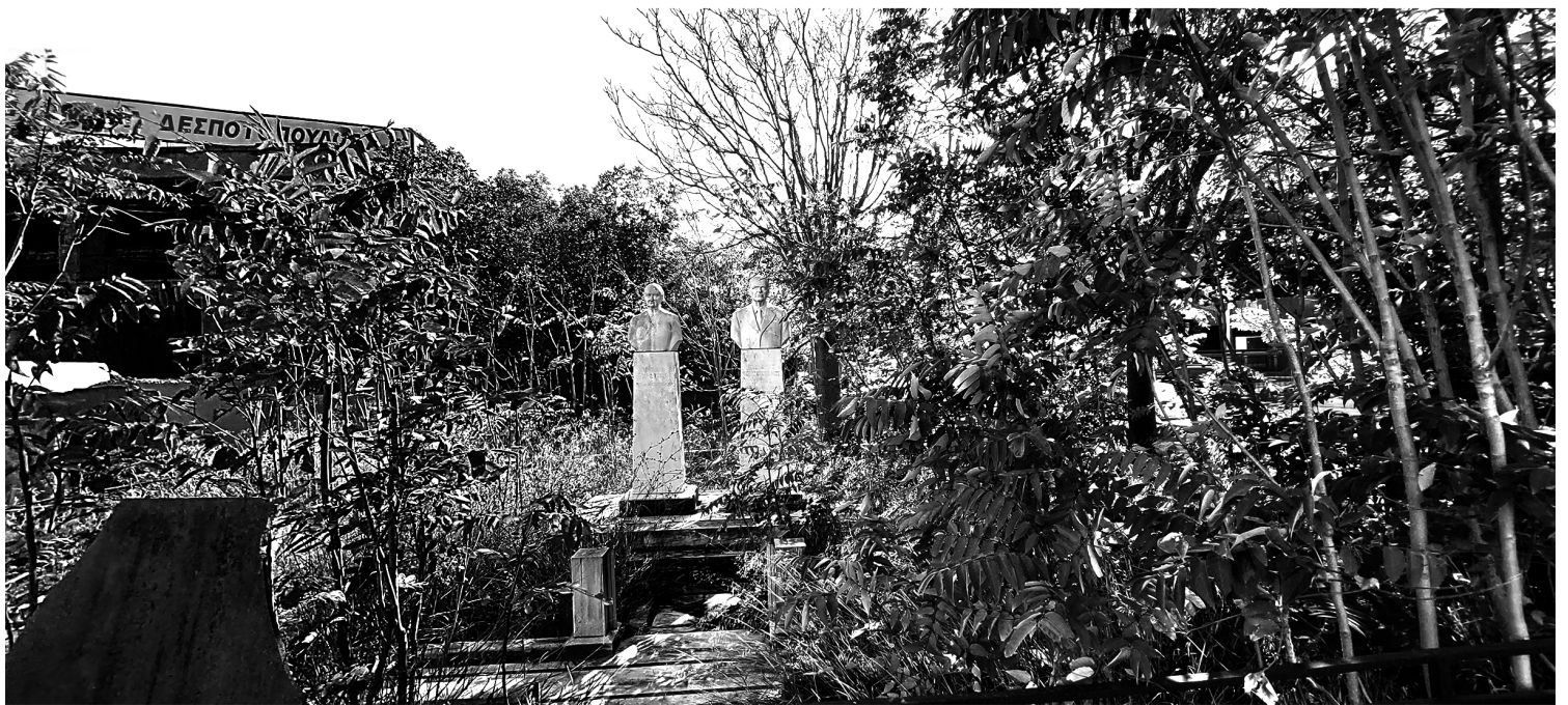
Επάνω: Μαρμαράδικο στο Μαρούσι. Κάτω: Μαρμάρινες παρουσίες στον περιβάλλοντα χώρο του Μαρμαράδικου.

Περνώντας από ένα μαρμαράδικο στο Μαρούσι, διακρίνω πλάι στον πέτρινο μαντρότοιχο του δυο ολόλευκες γλυπτικές φιγούρες. Στέκονται παράμερα από τον σωρό των μαρμάρινων θραυσμάτων, αθέατες σε πρώτη όψη.