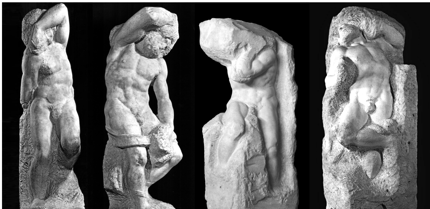
Michelangelo Buonarroti, «Οι φυλακισμένοι» - γλυπτά στο πρώτο μισό του 16ου αιώνα. Πηγή: « Il Rinascimento fiorentino e l'era dei Medici dal mito alla realtà (parte terza) », tuttatoscana.net.

Συνεχίζοντας τον συλλογισμό περί της αμφισημίας, διερωτάται κανείς γιατί ο Μιχαήλ Άγγελος αφήνει τα τρία πέμπτα από τα μαρμάρια γλυπτά του σε εισαγωγικά “ ημιτελή κατάσταση ” 8 . Η γραφή του στην ύλη συνηγορεί στην αφαιρετική εντύπωση της σύνθεσης, καθώς: χρησιμοποιεί επίπεδες επιφάνειες, αξιοποιεί την αδράνεια της άμορφης μάζας από την οποία λείπουν οι αντιθέσεις φωτοσκίασης, ενισχύει τη διάχυση της φόρμας και το φάσμα των τόνων, ώστε η προσοχή σου να επικεντρώνεται στην ανοιχτή ερμηνεία του έργου. Η γραφή αυτή στην ύλη προσκαλεί τον θεατή να ενεργοποιήσει τη φαντασία και τη μνήμη του.