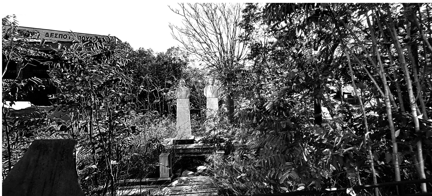
Επάνω: Μαρμαράδικο στο Μαρούσι. Κάτω: Μαρμάρινες παρουσίες στον περιβάλλοντα χώρο του Μαρμαράδικου.

Περνώντας από ένα μαρμαράδικο στο Μαρούσι, διακρίνω πλάι στον πέτρινο μαντρότοιχο του δυο ολόλευκες γλυπτικές φιγούρες. Στέκονται παράμερα από τον σωρό των μαρμάρινων θραυσμάτων, αθέατες σε πρώτη όψη.