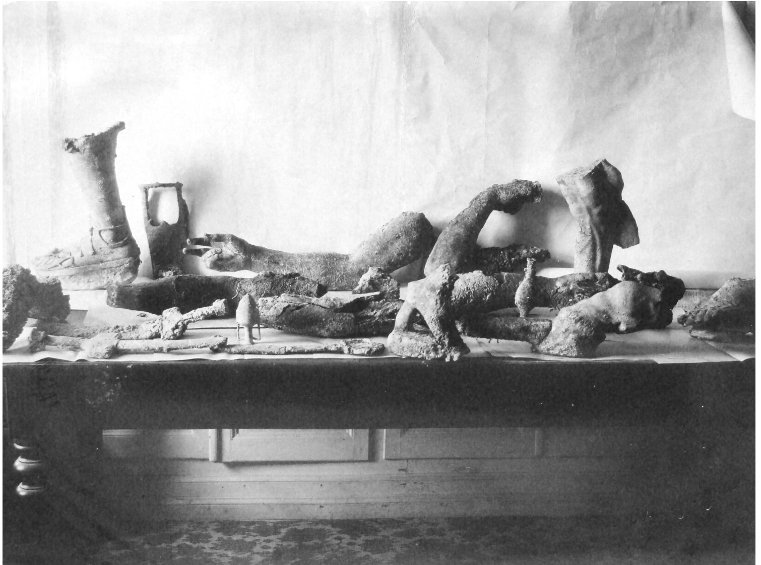
Θραύσματα από το Ναυάγιο των Αντικυθήρων. Φωτογραφία από την περιοδική έκθεση «Το Ναυάγιο των Αντικυθήρων. Το Πλοίο - οι Θησαυροί - ο Μηχανισμός», Εθνικό Αρχαιολογικό Μουσείο, 2012-2014.

Δεν είναι όμως μόνο η ύλη σε μετάβαση αλλά ο ίδιος μας ο συλλογισμός. Για να προσδώσει νόημα στην ύλη, ο νους συντάσσει παράλληλες ερμηνείες.