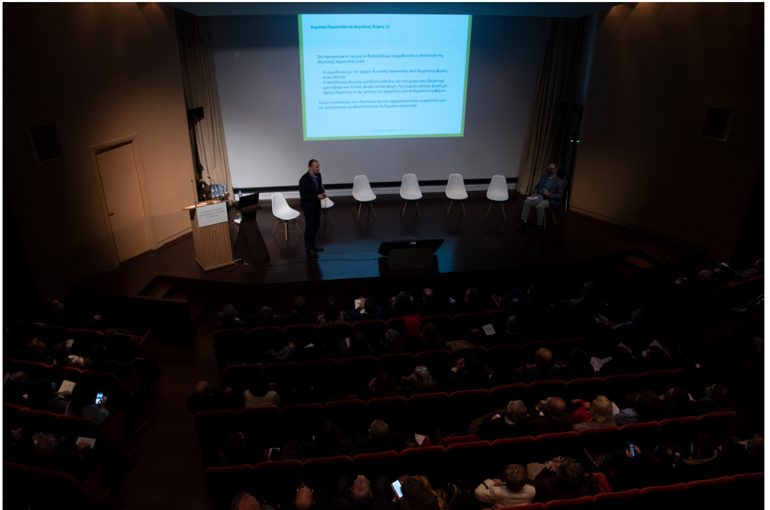
Εικόνα 06. Αμφιθέατρο Cotsen Hall. Στιγμιότυπο από την παρουσίαση του Κωνσταντίνου Φωτόπουλου.