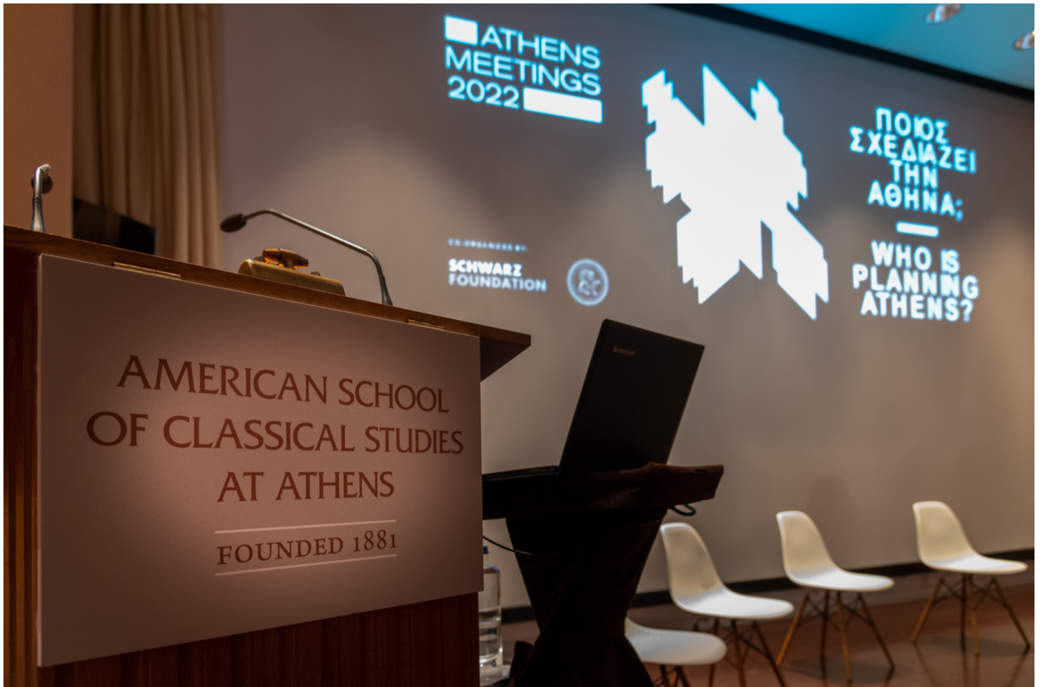
Εικόνα 01. Αμφιθέατρο Cotsen Hall.