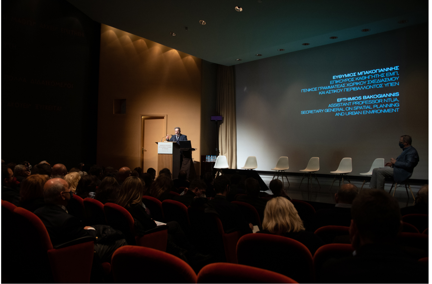
Εικόνα 08. Αμφιθέατρο Cotsen Hall. Στιγμιότυπο από την παρουσίαση του Ευθύμιου Μπακογιάννη.

πραγματοποιήσει το εν λόγω εγχείρημα, προσδιόρισε ότι ο φορέας υλοποίησης θα πρέπει να είναι μια δημόσια επιχείρηση ειδικού σκοπού, με τη συμμετοχή εκπροσώπων διαφόρων θεσμών του ευρύτερου δημόσιου τομέα, στην οποία θα παρέχεται το θεσμικό πλαίσιο δράσης και ανάληψης όλων των απαραίτητων λειτουργιών.