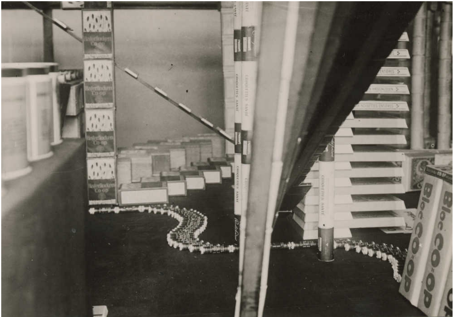
Εικόνα 05: Hannes Meyer, Co-op Vitrine (λεπτομέρεια), η δεύτερη σειρά στο Συνεταιριστικό Μέγαρο του Freidorf, Ελβετία, 1924/1925.

Ο Lahiji στηρίζει ότι: «ο βασικός παράγοντας που θα αποτελούσε το “ριζοσπαστικό” στοιχείο στη σημερινή φιλοσοφία ... είναι, χαρακτηριστικά, ένας “νέος υλισμός”». 19 Λαμβάνω την άποψη αυτή ως μια επιστροφή στη θεώρηση της αρχιτεκτονικής ως καθορίζουσα και καθοριζόμενη από την υλική και κοινωνική παραγωγή, μια άποψη που το άρθρο εκφράζει από την αρχή του. Είναι μια άποψη που επαναφέρει τον διττό χαρακτήρα της αρχιτεκτονικής: ως μιας πράξης σχεδιασμού την οποία κατασκευάζει ένα υποκείμενο με πολιτική σκέψη. Είναι ένα αίτημα ανάκτησης, ή αναδημιουργίας, της σύνδεσης μεταξύ του λόγου της «κριτικής ιδεολογίας» και της αρχιτεκτονικής σύνθεσης, ως την οργάνωση ζωτικών χώρων για τη χορογραφία της ζωής. 20