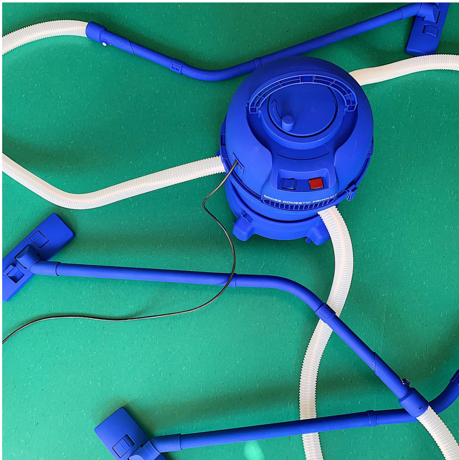
Εικόνα 01: Ηλεκτρική σκούπα για τρία άτομα. Edit Collective, Gross Domestic Product (GDP), Τριεννάλε Αρχιτεκτονικής του Όσλο, 2019.

Από τη δεκαετία του 1970 και έπειτα, με την αφομοίωση του μεταμοντέρνου στον αρχιτεκτονικό λόγο, η θεωρία του κλάδου αποσυνδέθηκε τελείως όχι μόνο από την ιδεολογική της λειτουργία αλλά και από οποιαδήποτε πιθανή σχέση και ευθύνη της αρχιτεκτονικής έναντι του συλλογικού. Αντιθέτως, η αρχιτεκτονική αντιμετωπίστηκε ως ένα καθαρά γλωσσολογικό υλικό που αδιαφορούσε για οποιαδήποτε «εξω-γλωσσικά» στοιχεία. Στα μέσα της δεκαετίας '80, η Mary McLeod επισήμανε για την περίοδο αυτή ότι η αρχιτεκτονική «δεν έχει σχεδόν καμία παράδοση Μαρξιστικής κριτικής ή ριζοσπαστικής πρακτικής εκτός της Σοβιετικής Ένωσης». 3 Η πιο σημαντική εξαίρεση στον κανόνα αυτό εμφανίστηκε στην Ιταλία, με μια νέα τάση που ανέπτυξε μια συστηματική ανάλυση της αρχιτεκτονικής μέσω της συγκεκριμένης προσέγγισης της Μαρξιστικής φιλοσοφίας που ακολουθούσε η Ιταλική Αριστερά εκείνης της εποχής. Η τάση αυτή περιελάμβανε διανοητές όπως ο Massimo Cacciari και ο Francesco Dal Co, με εξέχουσα φιγούρα αυτή του Manfredo Tafuri. Στο πλαίσιο της έρευνας αυτής, κεντρικής σημασίας είναι τα εξής δύο κείμενα του Tafuri: το άρθρο «Προς μια Κριτική της Αρχιτεκτονικής Ιδεολογίας» (1969) 4 και το «Αρχιτεκτονική και Ουτοπία: Σχεδιασμός και Καπιταλιστική Ανάπτυξη» (με πρώτη δημοσίευση του Ιταλικού πρωτοτύπου το 1973) 5 (Εικ.