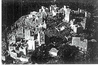
Εικόνα 02. Ορεινό χωριό Μάνης

Αναφέρεται ότι τα κατοικήσιμα δωμάτια πρέπει να είναι μεσημβρινά. Το αρχαίο σπίτι διαρθρωνόταν γύρω από αίθριο και είχε για θεμέλια και βάσεις τοίχων την πέτρα, πάνω σ' αυτά τοποθετούσαν πλίνθους με ξυλοδεσιές για να υψώσουν τους τοίχους. Οι στέγες ήταν σκεπασμένες με κεραμίδια και πολλές φορές αναφέρεται η ύπαρξη δωματίων, δηλαδή ταράτσας.