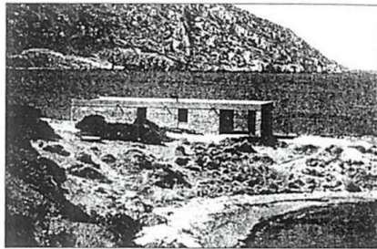
Εικόνα 04. Α. Κωνσταντινίδη: Σπίτι στην Ανάβυσσο

Στην έκφραση της ελληνικής αρχιτεκτονικής, οι τρόποι που χρησιμοποιήθηκαν ποικίλουν και κατά γεωγραφικές ενότητες, μορφολογικά, αλλά και στην εσωτερική τους διάρθρωση. Μακεδονίτικο σπίτι, ηπειρώτικο, στερεοελλαδίτικο, πελοποννησιακό, κρητικό, κυκλαδίτικο.