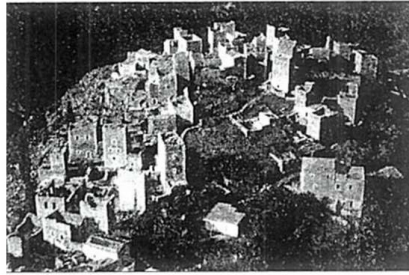
Εικόνα 02. Ορεινό χωριό Μάνης

Αναφέρεται ότι τα κατοικήσιμα δωμάτια πρέπει να είναι μεσημβρινά. Το αρχαίο σπίτι διαρθρωνόταν γύρω από αίθριο και είχε για θεμέλια και βάσεις τοίχων την πέτρα, πάνω σ' αυτά τοποθετούσαν πλίνθους με ξυλοδεσιές για να υψώσουν τους τοίχους. Οι στέγες ήταν σκεπασμένες με κεραμίδια και πολλές φορές αναφέρεται η ύπαρξη δωματίων, δηλαδή ταράτσας.