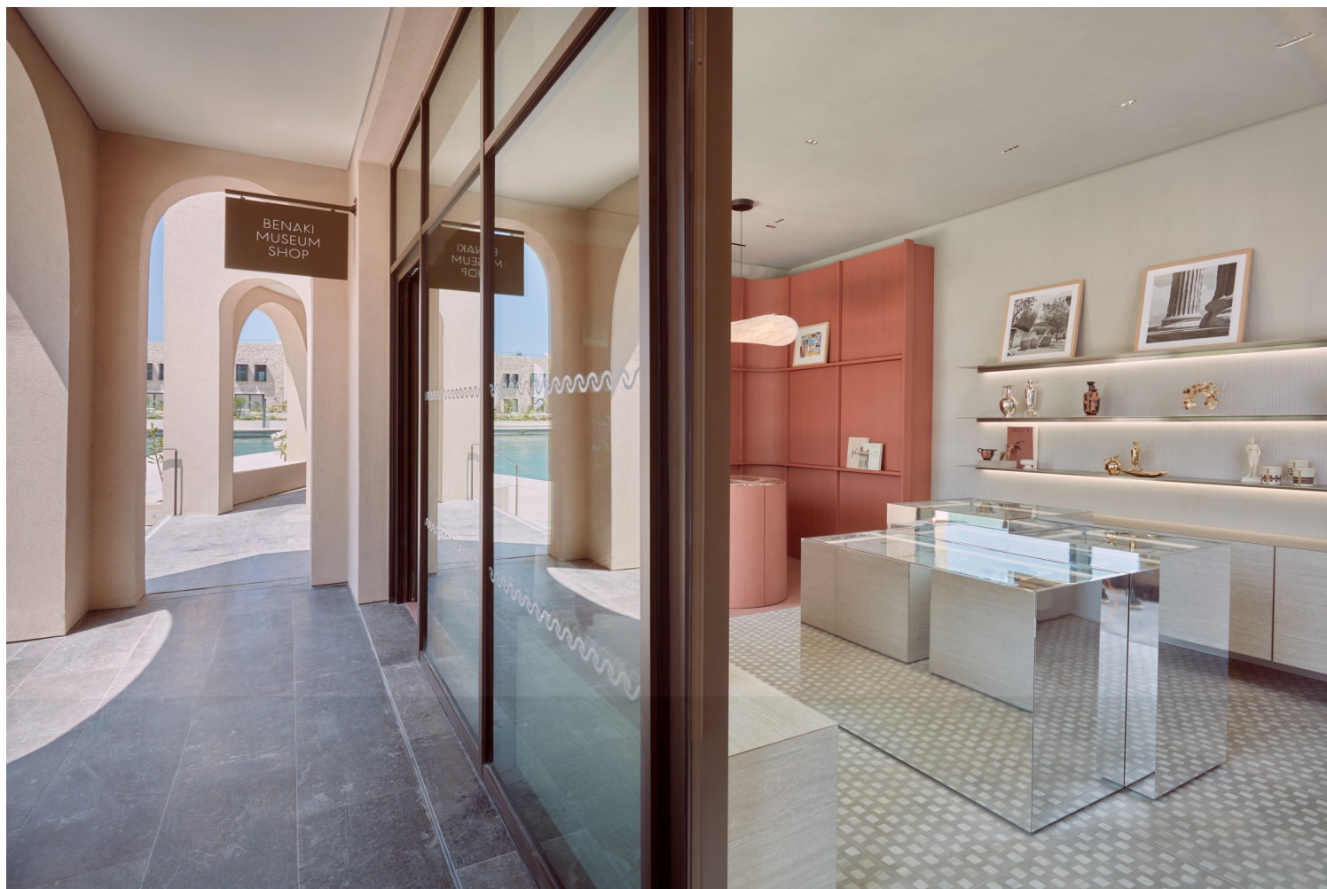
Το νέο κατάστημα του μουσείου Μπενάκη στο Navarino Agora, σε συνεργασία με την αρχιτέκτονα Κωνσταντία Μάνθου