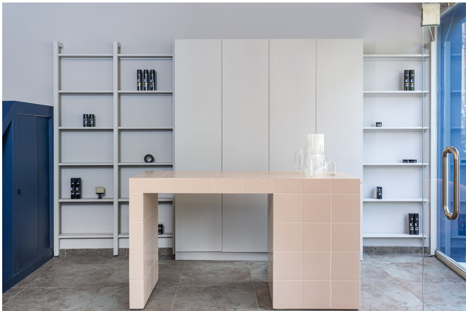
FLAT20 hair salon

Τέλος, φαίνεται ότι εξελίσεστε διαρκώς, με ένα από τα πιο πρόσφατα έργα που δημοσιεύσατε να είναι το νέο Benaki shop στο Costa Navarino. Μπορείτε να μας πείτε για πρόσφατα έργα ή συνεργασίες που έχουν διευρύνει-δοκιμάσει τα δημιουργικά όριά σας και έχουν επεκτείνει τα όρια του design είτε στο Λουδίνο είτε στην Αθήνα;