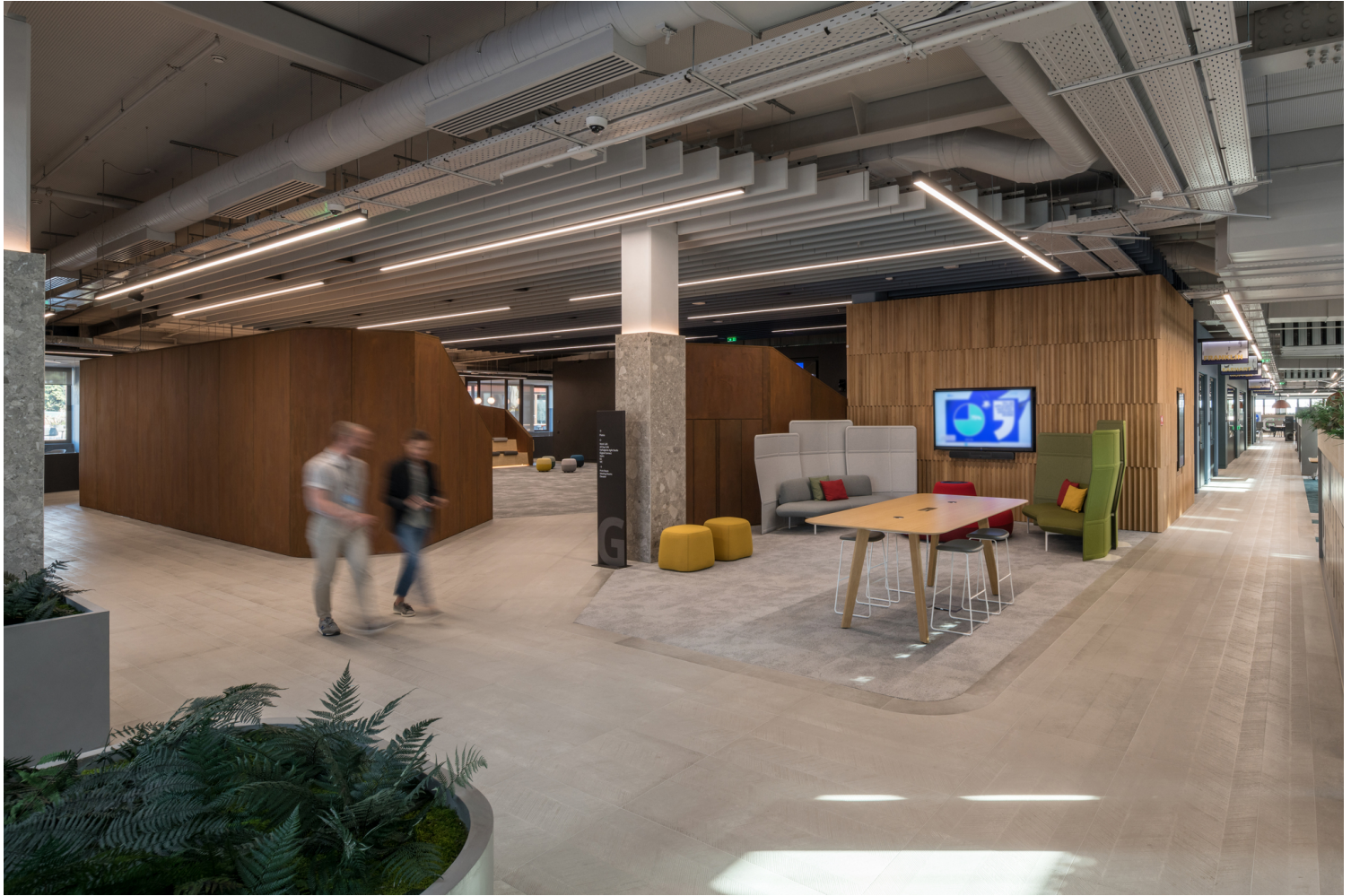
Επιμέλεια εικόνας: Γιώργος Σφακιανάκης

Η Θεσσαλονίκη είναι μια πόλη με έντονη ιστορία, πολύτροπες αρχιτεκτονικές αφηγήσεις και εναλλαγές στην πολεοδομία της. Το παράκτιο μέτωπο και η σύγχρονη ανάπλασή του, σε συνομιλία με το παλιό λιμάνι, δημιουργούν έναν αρχιτεκτονικό διάλογο, θέτοντας άξονες που καθορίζουν τη σύγχρονη ελληνική αρχιτεκτονική. Κάποια από τα παραπάνω αποτελούν και σημεία αναφοράς του γραφείου eDje Architects, για την επιμέλεια και τον σχεδιασμό του campus 7.000 τετραγωνικών μέτρων. Το συγκρότημα συνοψίζει χρήσεις και ενδιαμέσους χώρους που περιγράφουν ένα εργασιακό περιβάλλον, μακριά από τις αυστηρές οριοθετήσεις και τα ετεροχρονισμένα μοντέλα εργασιακών χώρων που έχουμε συνηθίσει.