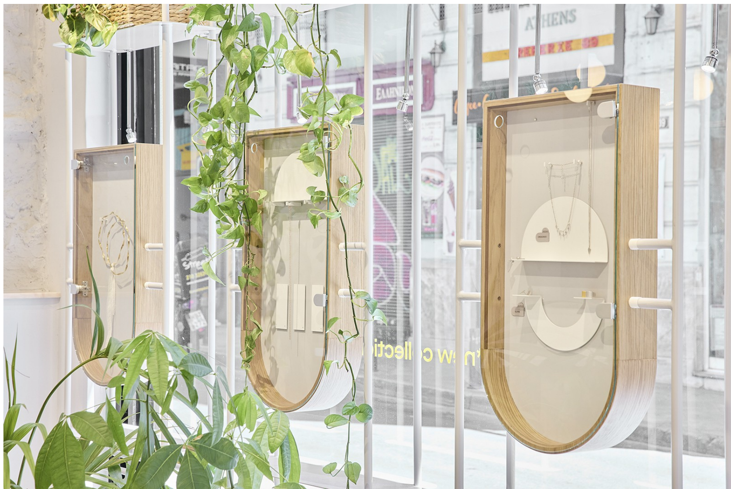
Prigipio. Σχεδιασμός καταστήματος κοσμημάτων στην Αθήνα, 2021