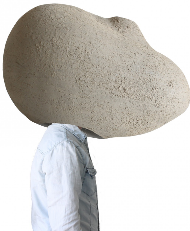
Διακριθείσα συμμετοχή στον αρχιτεκτονικό διαγωνισμό COCOON Competition. Greek Institute of Architects in New York [GIANY], 2016