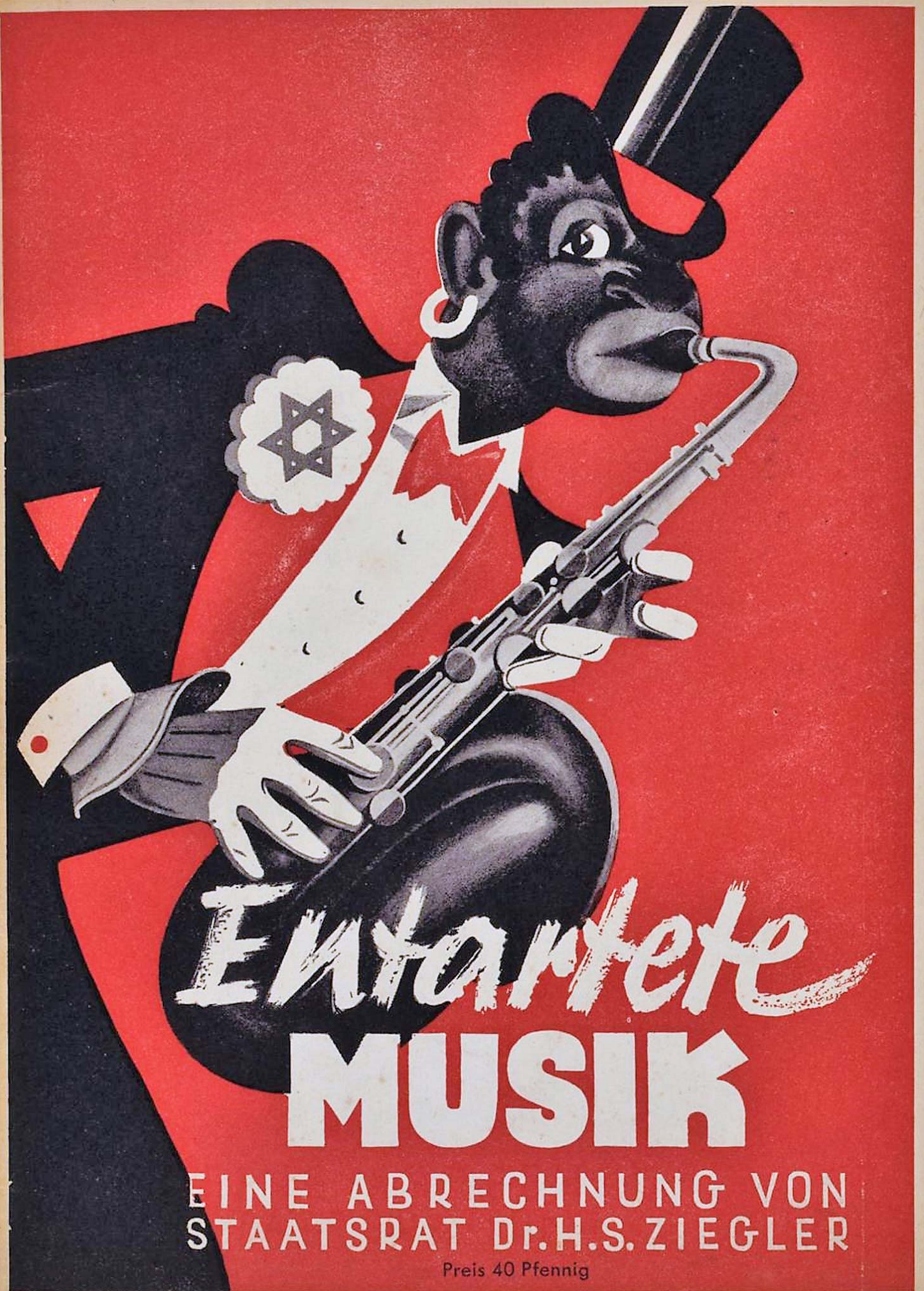
Αφίσα έκθεσης _καταραμένης μουσικής_ του 1938 στο Ντίσελντορφ.