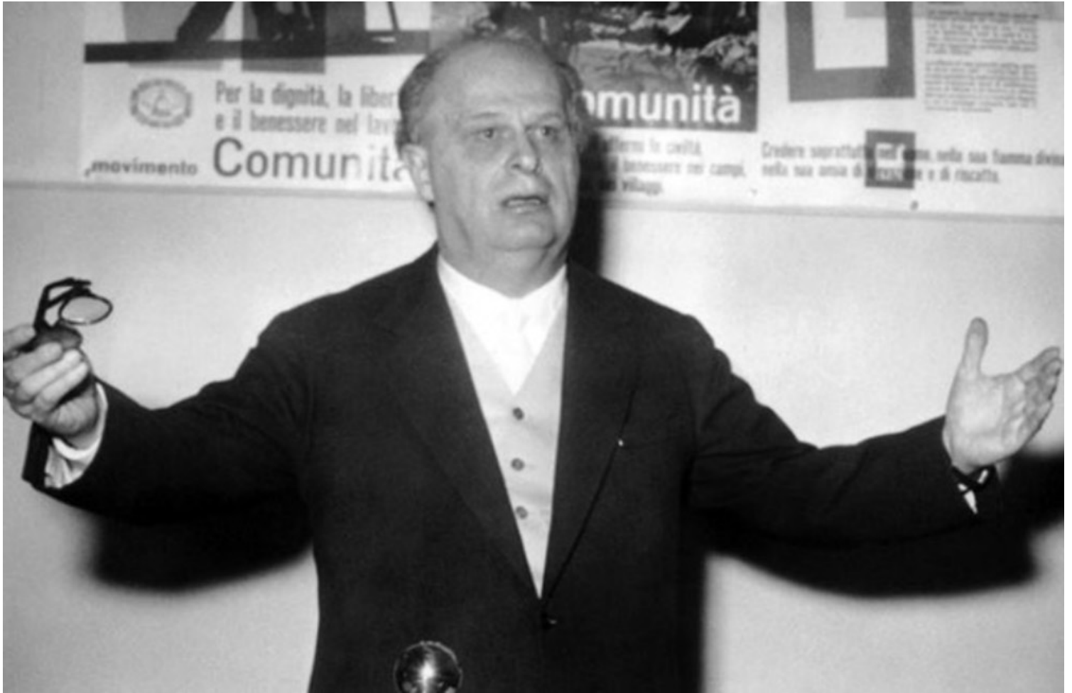
Εικόνα 1. Ο Adriano Olivetti