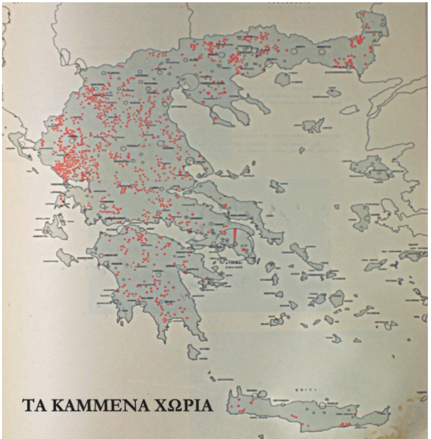
Εικόνα 7. Χάρτης που αποτυπώνει τα χωριά που κάηκαν κατά τον Β' Παγκόσμιο Πόλεμο, που περιλαμβάνονταν στην στατιστική έκθεση των πολεμικών καταστροφών της Ελλάδας, την οποία επιμελήθηκε ο Κωνσταντίνος Α. Δοξιάδης.

Ο Δοξιάδης ήταν υποδιευθυντής και γενικός διευθυντής του Υπουργείου Στέγασης και Ανοικοδόμησης μεταξύ 1945 και 1948 (εικ. 8), συντονιστής του Ελληνικού Προγράμματος Ανάκαμψης και Υφυπουργός του Υπουργείου Συντονισμού μεταξύ 1948 και 1950. Κατά τη διάρκεια των τριών πρώτων ετών της θητείας του ως διευθυντής του Υπουργείου Στέγασης και Ανοικοδόμησης, 561 οικισμοί ερευνήθηκαν και 230 νέα αστικά σχέδια σχεδιάστηκαν. Η επιβίωση του ελληνικού λαού ήταν προϊόν συνεργασίας τού Δοξιάδη με άλλους ειδικούς. Η εκ του σύνεγγυς εξέταση αυτού του εγγράφου προσφέρει μια κατανόηση της προσπάθειας εκσυγχρονισμού κατά τη διάρκεια των μεταπολεμικών χρόνων στην Ελλάδα. Αυτό που κρύβεται πίσω από αυτό το σχέδιο, είναι η θεωρία του Δοξιάδη σχετικά με την κοινωνική εξέλιξη, η οποία βασίζεται σε μια βιολογική αναλογία μεταξύ των εθνών και των ζωντανών οργανισμών. Χαρακτηριστικά, ο Δοξιάδης σημειώνει, κάπου μεταξύ του 1946 και του 1947 στο Η επιβίωση του ελληνικού λαού: «τα έθνη είναι ζωντανοί οργανισμοί, εξελισσόμενοι από πρωτογενείς και στοιχειώδεις μορφές σε πιο ολοκληρωμένες. Όπως όλοι οι ζωντανοί οργανισμοί, οι λαοί περνούν από διάφορα στάδια ανάπτυξης.»