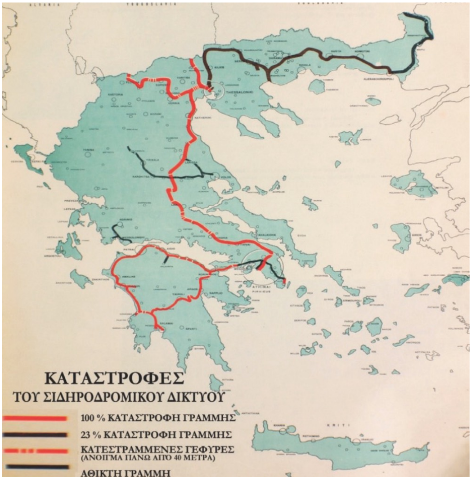
Εικόνα 6. Χάρτης που αποτυπώνει τις καταστροφές του σιδηροδρομικού δικτύου της Ελλάδας κατά το Β' Παγκόσμιο Πόλεμο, που περιλαμβάνονται στην στατιστική έκθεση των πολεμικών καταστροφών της Ελλάδας, την οποία επιμελήθηκε ο Κωνσταντίνος Α. Δοξιάδης.