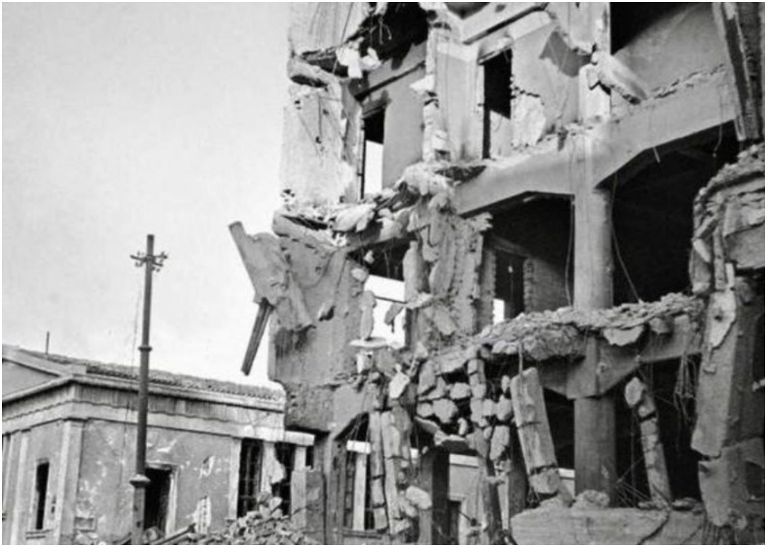
Εικόνα 4. Ιανουάριος 1945. Η ηγεσία του ΕΜΠ και, σε πρώτο πλάνο, το κατεστραμμένο από τις μάχες κτίριο της Γενικής Ασφάλειας