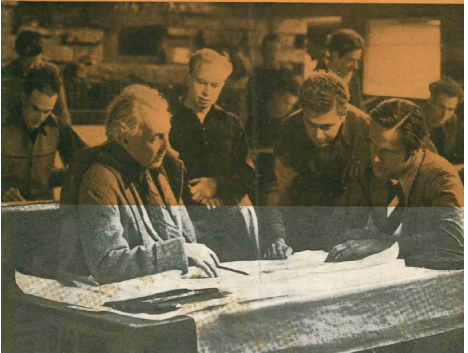
Εικόνα 2. Το εξώφυλλο του 23ου τεύχους του περιοδικού Comunità.