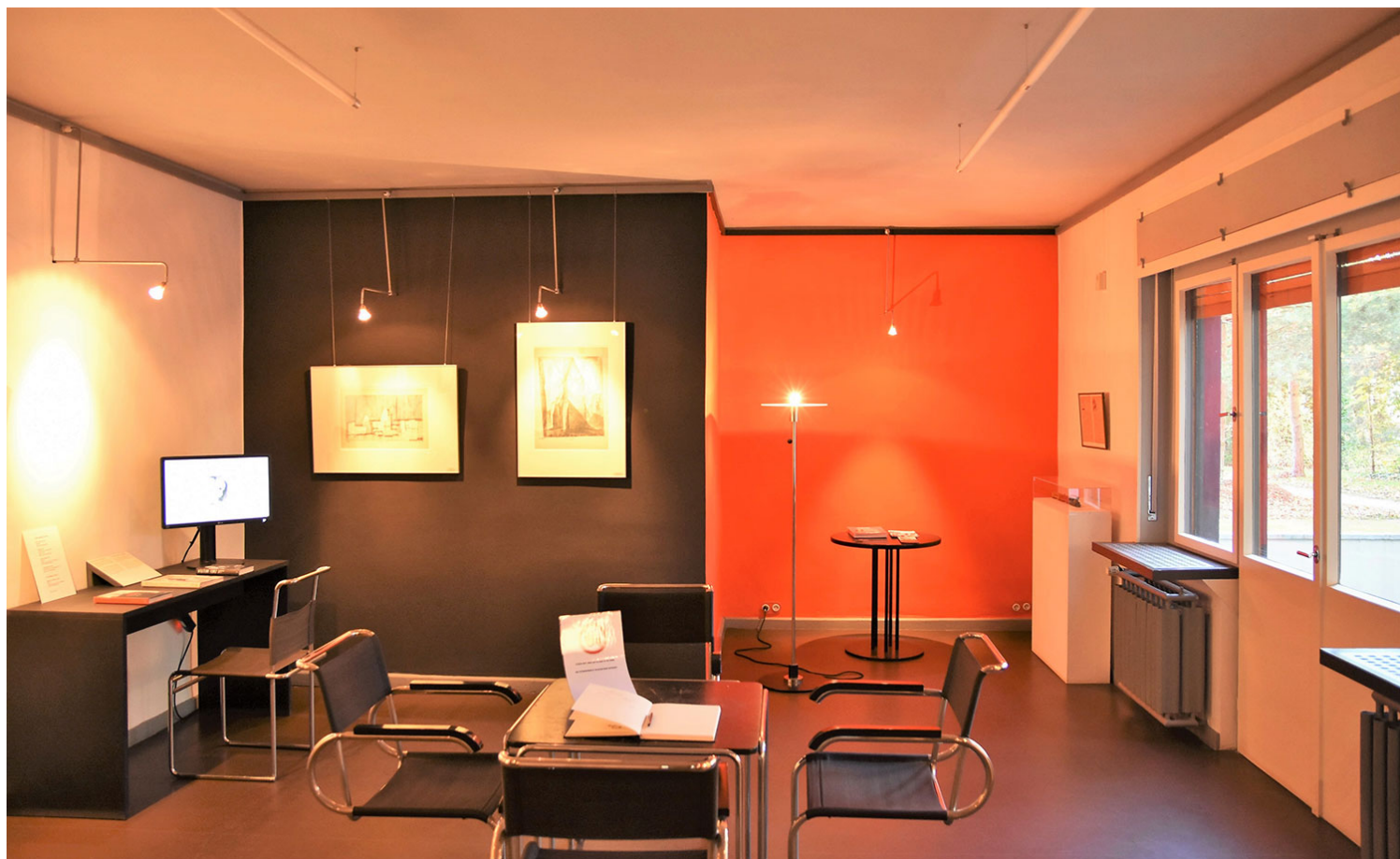
Το εσωτερικό της κατοικίας Kandinsky-Klee (φωτογρ. 2017).