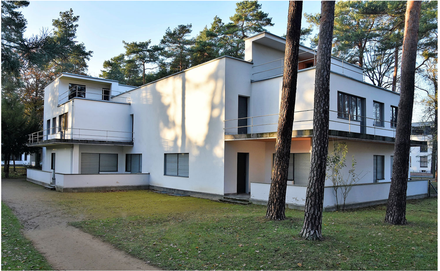
W. Gropius, Η διπλή κατοικία Kandinsky-Klee στο Ντεσσάου (άποψη από τον κήπο), 1925.

ποιότητας των βιομηχανικών προϊόντων, και κατά συνέπεια των εμπορικών δραστηριοτήτων και εξαγωγών.