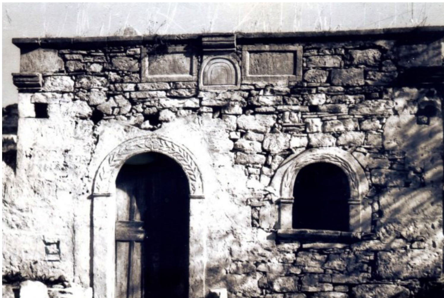
Το πατητήρι 1956-57

Το 2011 έγινε από τη Σχολή μας -στο πλαίσιο του μαθήματος του 8ου εξαμήνου της Οικοδομικής- μία συστηματική και ακριβής αποτύπωση του σπιτιού στην κατάσταση που βρισκόταν τότε. Ήταν μια προσπάθεια να καταγραφεί, έστω και σε σχέδια, αυτό που σε λίγο -ήταν βέβαιο- δεν θα υπήρχε πλέον.