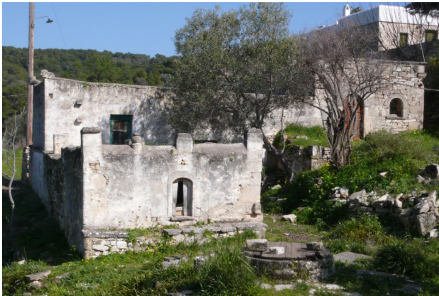
Το σπίτι το 2011, αρχείο Τ. Παπαϊωάννου