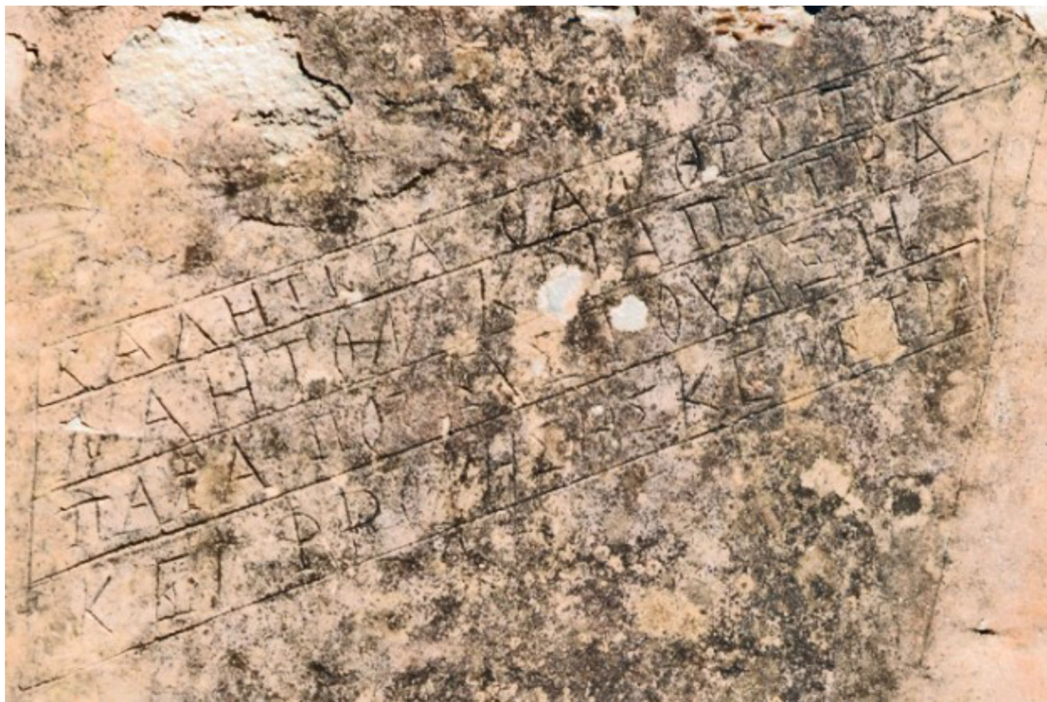
Οι στίχοι στο πατητήρι-2011

Αλλά γιατί τα λέω όλα αυτά; Έχουν καμιά σημασία σε μια χώρα που στενάζει και θυσιάζεται στον βωμό των Μνημονίων; Που οι λέξεις που συντροφεύουν καθημερινά πια τη ζωή μας είναι οικονομική ανάπτυξη, ανακεφαλαιοποίηση, φόροι, προϋπολογισμοί; Λέξη για την τέχνη, την αρχιτεκτονική, τον πολιτισμό!