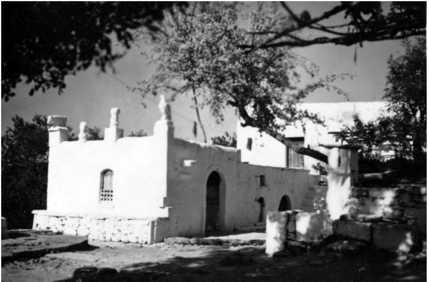
Σπίτι Ροδάκη

Σήμερα έχουν απομείνει μόνον οι δύο αγριωπές ολόγλυφες μορφές των μυστακοφόρων ανδρών, ως «εξαίσια ακρωτήρια» 2 , στις γωνίες του δώματος να αγναντεύουν μακριά, «σα με μυστικό βλέμμα» 3 , τις πλαγιές του Μεσαγρού. Πάνω σ' αυτές τις μορφές «αποτυπώνονται με υπέροχο τρόπο οι λαϊκές δοξασίες, οι θρύλοι και τα «ξόρκια» που έρχονται από πολύ βαθιά μέσα από τη λαϊκή παράδοση» 4 .