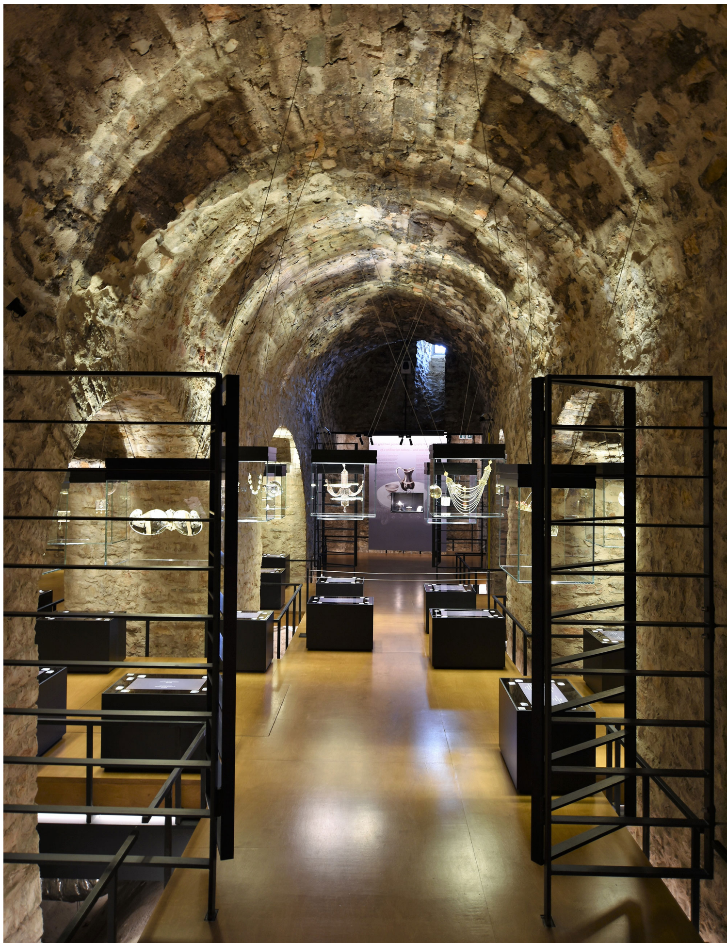
Μουσείο Αργυροτεχνίας Ιωαννίνων