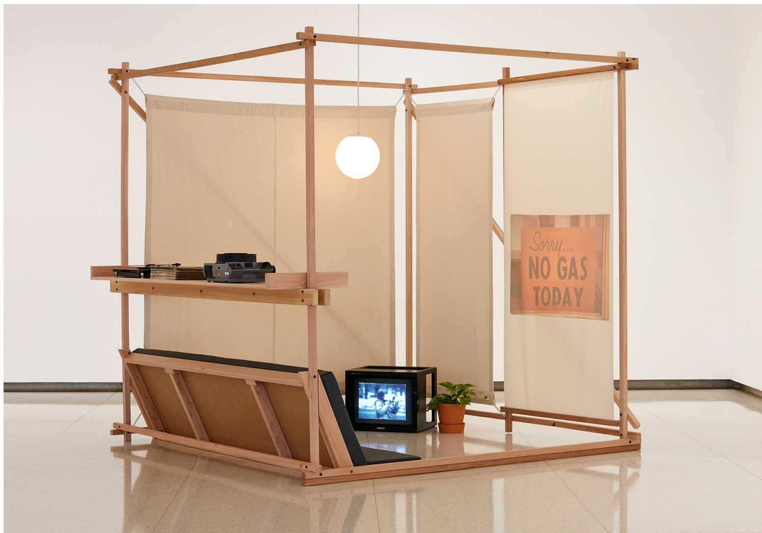
Victor Papanek and James Hennessey, Relaxation Cube from Nomadic Furniture 1, 1973/2015

Όπως διατεινόταν ο Papanek, οι σχεδιαστές θα πρέπει να αυτονομηθούν ιδεολογικά και να κάνουν τις δικές τους επιλογές ηθικά και υπεύθυνα, μη αμβλύνοντας άλλο τις κρίσεις που έχουν προκύψει στον κόσμο. “ To Design ”, έλεγε, “για να γίνει συνεπές στις οικολογικές ανάγκες και στις κοινωνικές εξελίξεις, πρέπει να είναι επαναστατικό και δριμύ” (radical). Έτσι, ο Papanek ίσως να ήταν ο πρώτος που πρότεινε ως μοναδική λύση για την αποφυγή των σύγχρονων προβλημάτων τη χαμηλότερη κατανάλωση υλικών, την επανάχρηση και τη δημιουργία αντικειμένων από βιώσιμα και ανακυκλωμένα υλικά (Papanek, 1985, pp.346-347). Επιπλέον, στα τέλη της δεκαετίας του ‘70, σχεδιάζει ένα καινοτόμο μοντέλο της εταιρείας αυτοκινήτων VOLVO , το οποίο ονομάστηκε “ experimental city taxi ”. Εκτέθηκε στο MoMA το ‘76 ως μια εκδοχή -από τις πολλές- για πραγματικό και αναγκαίο design. Το “ realistic solutions for Today ” παρουσίαζε ένα αμάξι-ταξί, του οποίου ο σχεδιασμός θα ήταν συνυφασμένος με την προσβασιμότητα των ατόμων με κινητικές δυσκολίες. Προσέφερε τη δυνατότητα, δηλαδή, σε επιβάτες σε αμαξίδιο να εισέρχονται στο επιβατηγό όχημα, χωρίς τη βοήθεια του οδηγού ή κάποιου τρίτου, ενώ καθιστούσε την -ακόμα- απαραίτητη αποθήκευση του εν λόγω αμαξιδίου παρελθόν, καθώς ο επιβάτης μπορούσε να μπει με αυτό στο ταξί (βλ. βίντεο από Volkswagen Group - Culture X Vitra Design Museum).