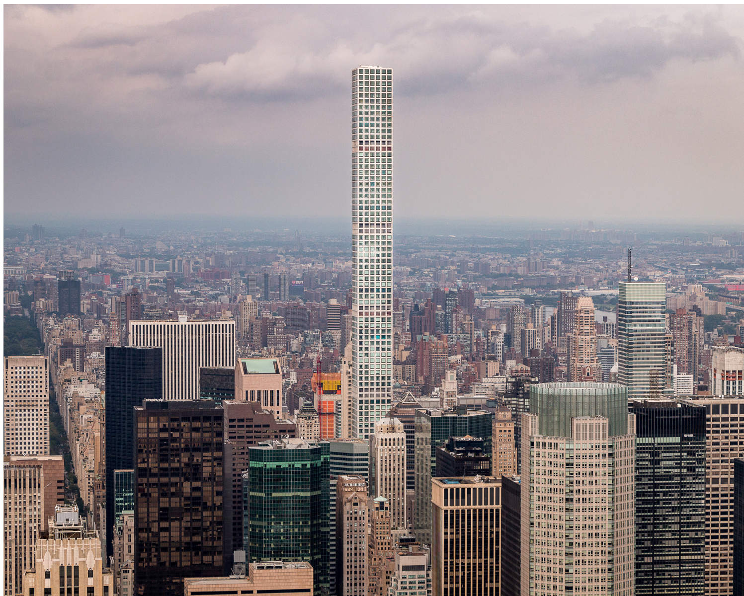
Rafael Viñoly, 432 Park Avenue, Νέα Υόρκη