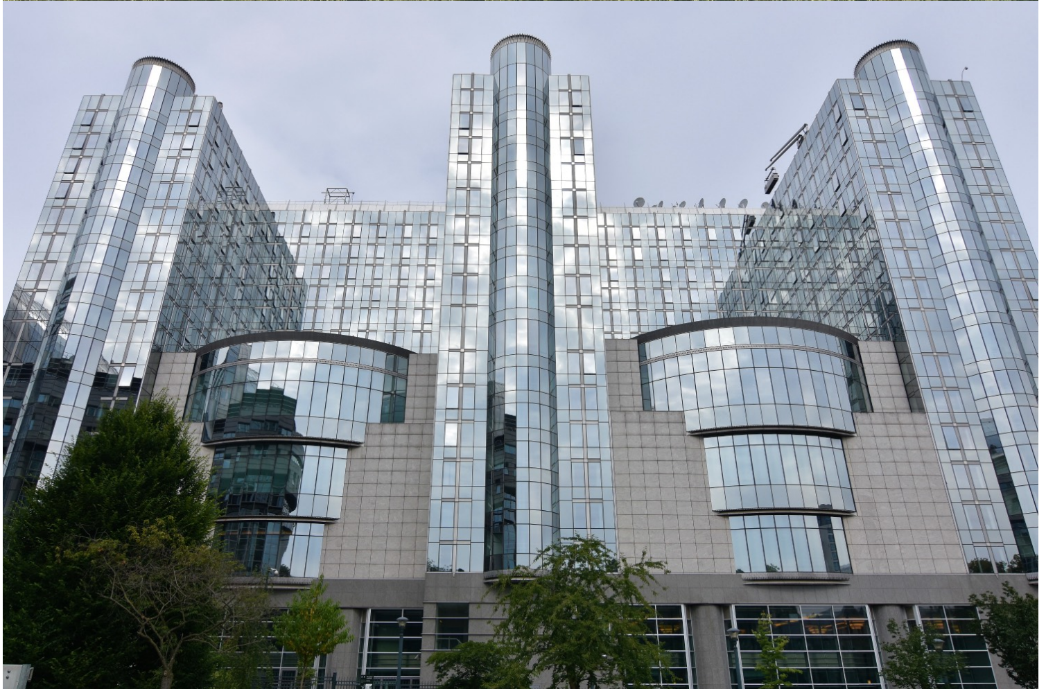
(Εικ.08,09) Απόψεις του ρητορικού και οπερετικού μεταμοντερνισμού του συγκροτήματος του Ευρωκοινοβουλίου, που ολοκληρώθηκε το 1998.