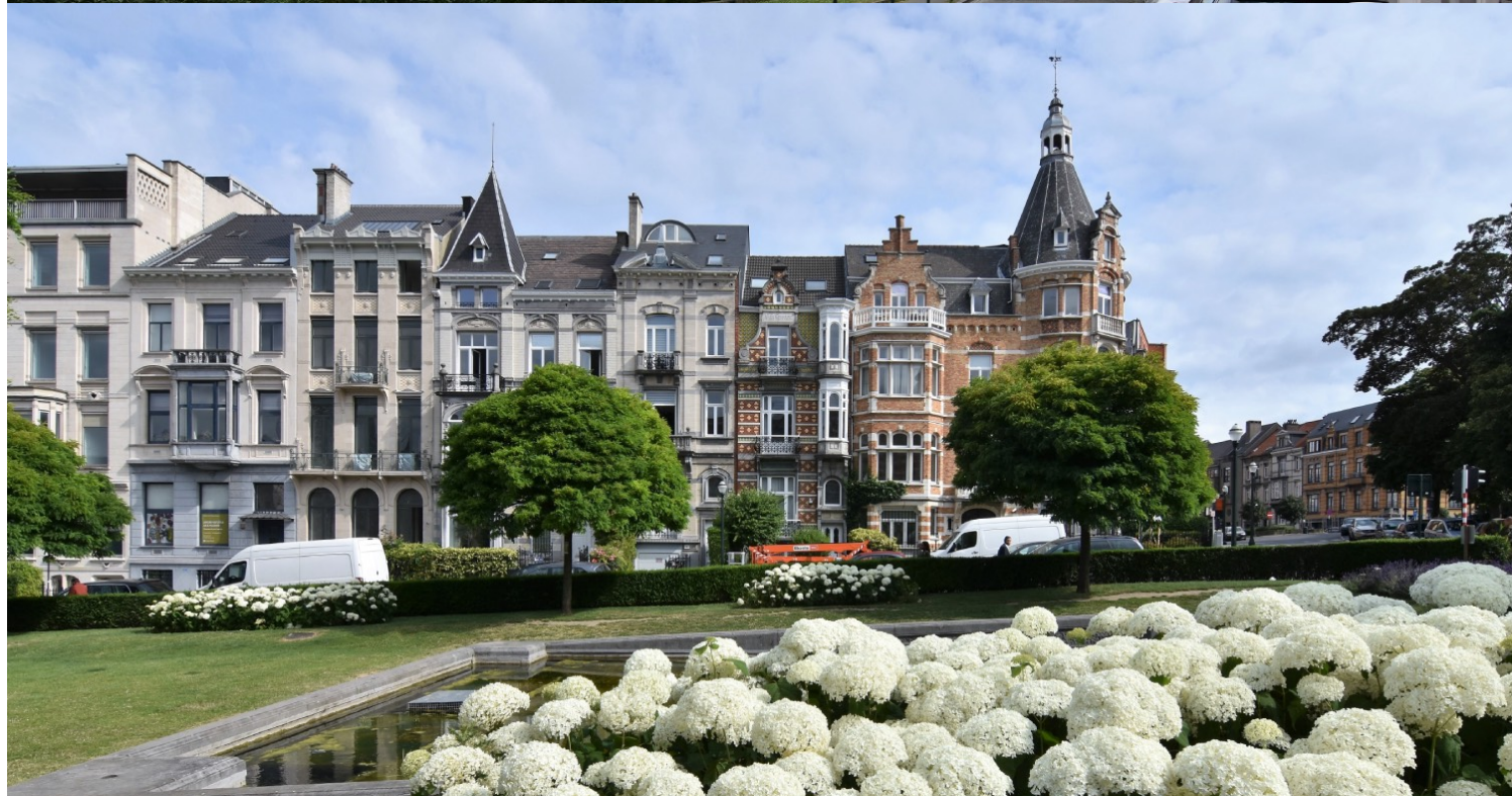
(Εικ.04,05) Απόψεις της Ixelles, της «ευρωπαϊκής συνοικίας» των Βρυξελλών.

Το γιγάντιο Berlaymont, το πιο γνωστό και τηλεοπτικά δημοφιλές κτίριο της Ένωσης με τη χαρακτηριστική σταυροειδή κάτοψη, υλοποιήθηκε την περίοδο 1963-1969 και γνώρισε περιπέτειες αντάξιες του θεσμού που εξυπηρετεί: εκκενώθηκε το 1991 και ανακατασκευαζόταν ως το 2004, για να απαλλαγεί μεταξύ άλλων από τους τόνους αμιάντου που είχαν χρησιμοποιηθεί για την κατασκευή του. (εικ. 06, 07) Η παρουσία του στη συγκεκριμένη θέση υπήρξε ο μαγνήτης για την υλοποίηση σειράς κτιριακών συγκροτημάτων, έτσι ώστε να βρουν στέγη οι όλο και πιο πολυάριθμες και απαιτητικές σε χώρους υπηρεσίες της Ένωσης, αρχής γενομένης από το Ευρωπαϊκό Συμβούλιο. Χωρίς πολεοδομική μελέτη, χωρίς δημόσιο προγραμματισμό και σχεδιασμό, στην περιοχή της «ευρωπαϊκής συνοικίας» και κυρίως γύρω από τον κεντρικό κόμβο της κυκλοφοριακά προβληματικής πλατείας Schuman, ξεκίνησε η σταδιακή εισβολή νέων μεγάλων κτιριακών μονάδων στη θέση των χαρακτηριστικών εκλεκτικιστικών συνόλων που συνθέτουν την ταυτότητα της πόλης, δημιουργώντας σταδιακά ένα νέο κομμάτι «πόλης», ανώνυμο, ανοίκειο και δίχως χαρακτήρα.