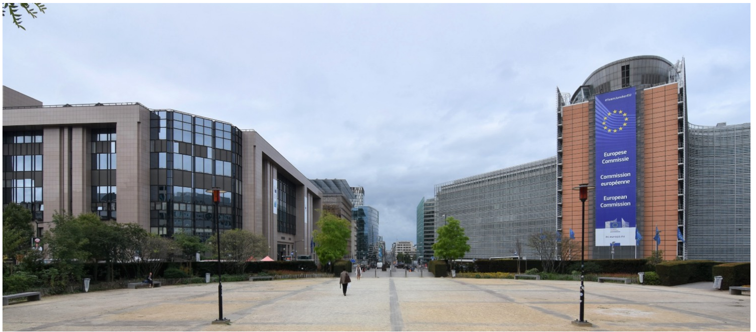
(Εικ.14) Άποψη από την πλατεία Schuman του κτιρίου του Berlaymont και, αριστερά, του Justus Lipsius, του πρώτου κτιρίου του Ευρωπαϊκού Συμβουλίου (1889-1995). Η απωθητική ρητορική αυτής της κατασκευής είναι αντιπροσωπευτική του χαρακτήρα και του ύφους αντίστοιχων κτιρίων της περιοχής. Πολύ πιο ενδιαφέρουσες ποιότητες εμφανίζει το νέο κτίριο του Συμβουλίου που μόλις διακρίνεται από πίσω (Philippe Samyn and Partners, Studio Valle, Buro Happold, 2005-2016). Στο κέντρο ο άξονας της rue de la Loi.