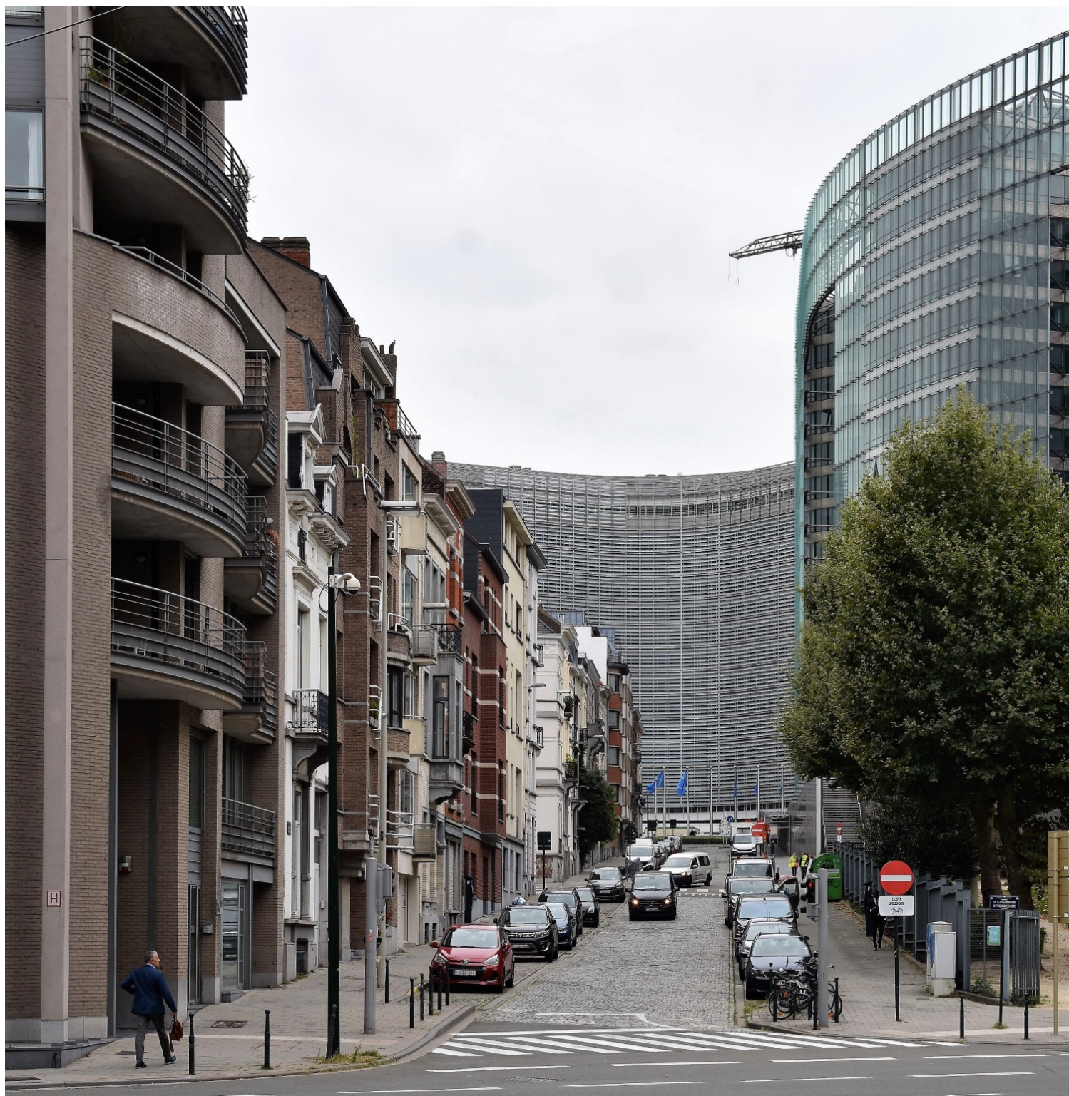
(Εικ.06,07) Το μεγαθήριο του Palais Berlaymont (στο βάθος) και μιας ακόμη υπηρεσίας της Ευρωπαϊκής Επιτροπής (δεξιά), όπως «συνδιαλέγονται» με το αρμονικό περιβάλλον των κτιρίων κατοικιών του 19ου και 20ού αιώνα.

Η βελγική διοίκηση, επιδιώκοντας να «διευκολύνει» κατά το δυνατόν την εγκατάσταση της Ένωσης στην πρωτεύουσά της (για να μη χάσει δηλαδή τον πελάτη), έκανε ό,τι μπορούσε (δηλαδή τίποτα) για να παραχωρήσει κάθε δυνατότητα ελέγχου των εξελίξεων στην πρωτοβουλία των ιδιωτών και των εργολάβων. Δημιουργήθηκε έτσι ένας αστικός τομέας (ο ωραιότερος ίσως και πιο εμβληματικός, αυτός που εκτείνεται από το Πάρκο της Πεντηκονταετίας μέχρι το Πάρκο του Λεοπόλδου στην πλατεία Λουξεμβούργου) με χαρακτηριστικά ανωνυμίας, ένας άνοστος χυλός αυτού που οι κάτοικοι αποκαλούν πολύ εύγλωττα «ευρωγκέτο» και το οποίο αποφεύγουν επιμελώς. (εικ. 08, 09) (εικ. 10) Ακόμη και το Πάρκο του Λεοπόλδου, μια υπέροχη ζώνη πρασίνου του δεύτερου μισού του 19ου αιώνα, με ζωολογικό κήπο και ιστορικά κτίρια που στέγαζαν ερευνητικές δραστηριότητες, καταπατήθηκε στην κυριολεξία από το γιγαντιαίο συγκρότημα του Ευρωπαϊκού Κοινοβουλίου, εμβληματικού παραδείγματος μεταξύ άλλων του πλέον κοινότοπου και διεκπεραιωτικού μεταμοντερνισμού που κυριάρχησε στην πόλη από τη δεκαετία του 1980 και μετά (από την άποψη αυτή είναι παραδειγματικό και το μεταμοντέρνο «καπέλο» στο Théâtre de la Monnaie, την όπερα των