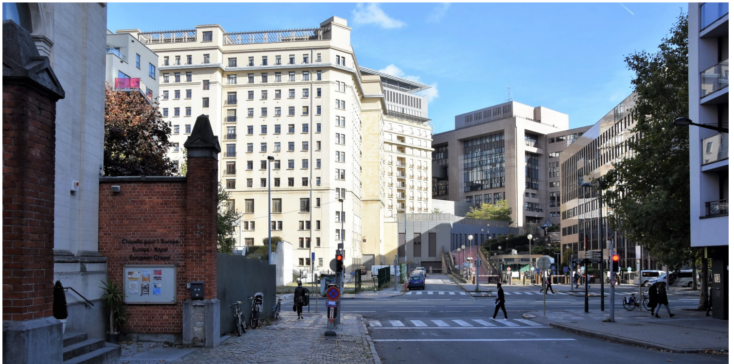
(Εικ.15) Μεταμοντέρνες αδιάφορες προσθήκες στο International Press Center, πίσω από το νέο κτίριο της Ευρωπαϊκής Επιτροπής. Δεξιά, το κτίριο Justus Lipsius. Οι κλίμακες και το ύφος των επεμβάσεων δεν συνάδουν με το περιβάλλον και τις γειτονίες της πόλης στις οποίες εγκαθίστανται.