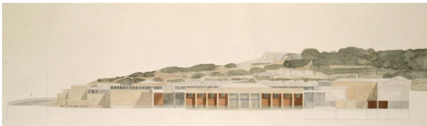
Εικόνα 8. Ακουαρέλα του Κυριάκου Κρόκου από τη μελέτη του Μουσείου της Ακρόπολης.