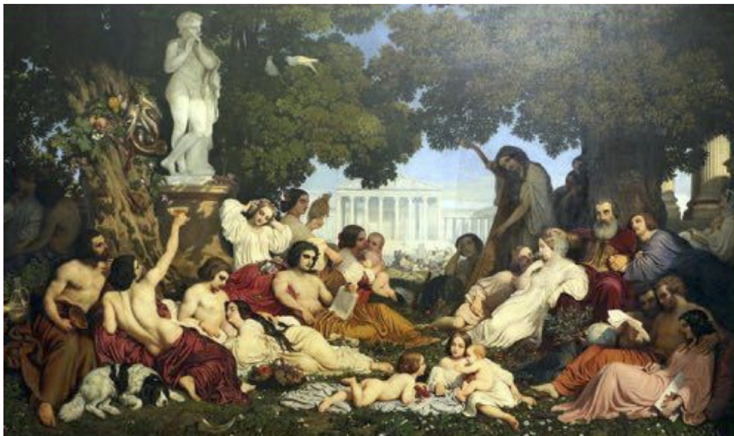
Εικόνα 1. Dominique Louis Papety, Rêve de bonheur , 1831.