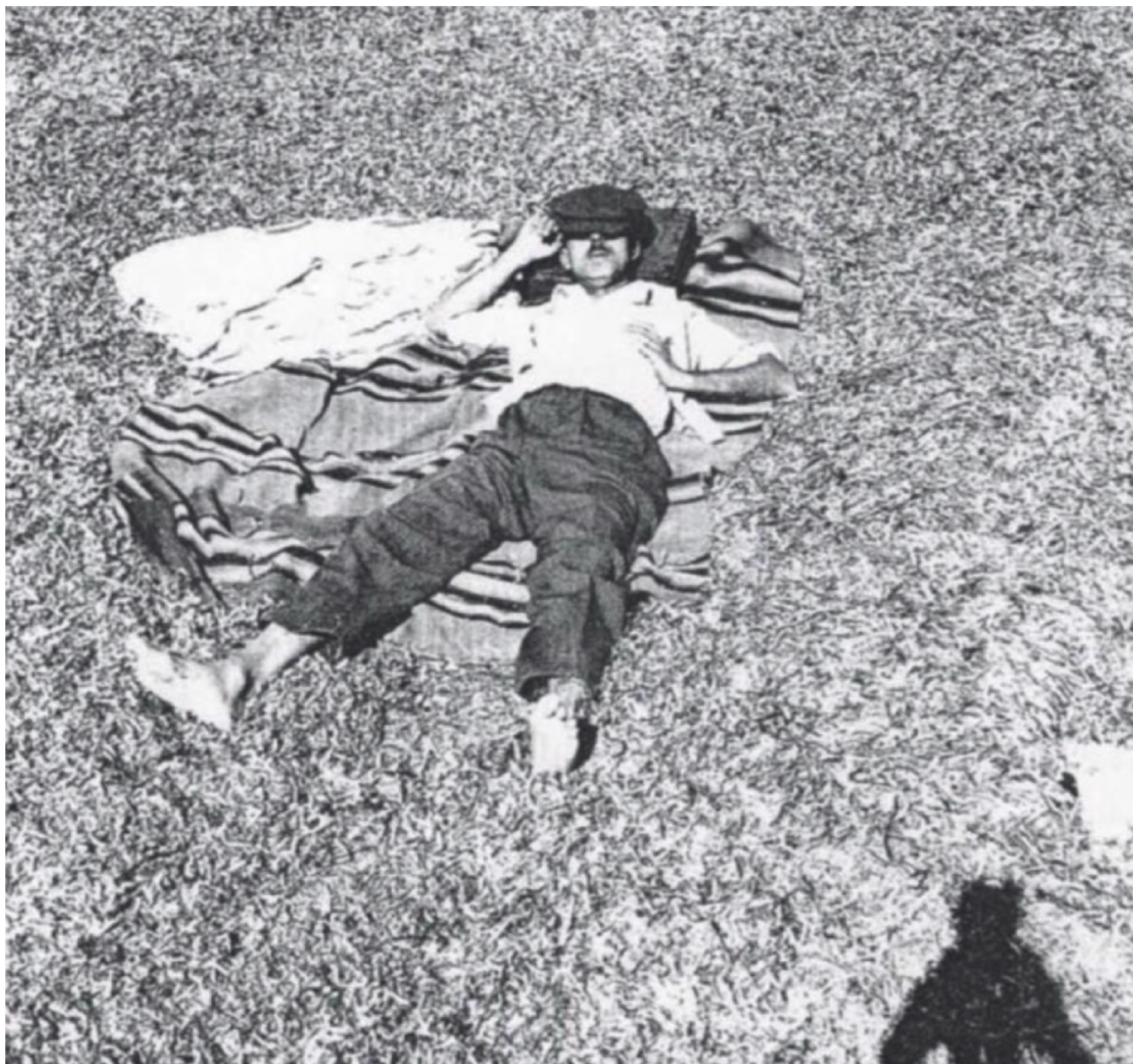
Εικόνα 7. Φωτογραφία του Άρη Κωνσταντινίδη για τη ζωή στην ύπαιθρο (Πηγή: Αρχείο Άρη Κωνσταντινίδη).